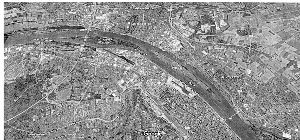
il. 2. Ren w Mainz. Zdjęcie lotnicze Google Maps / Rhine River in Mainz

The activity to prepare a design of green space structures is based on legal regulations. It must be remembered to prepare financial aid offers and local restoration programmes to defeat the owner barriers. Thanks to urban community activity in projects – they help to persuade the land owners. Main reason for this restoration is the lack of funds (similar to the western countries). Furthermore, in European cities, where public – private partnership is a distinctive feature of restoration processes and tasks are divided among the partners like in Vienna or Mainz, which shortened the