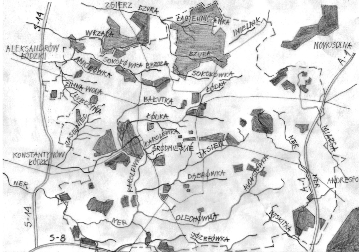
il. 4. Układ sieci rzek, cieków i terenów zieleni w aglomeracji Łódzkiej. Szkic autorów / System of rivers, watercourses and green areas in the Lodz region