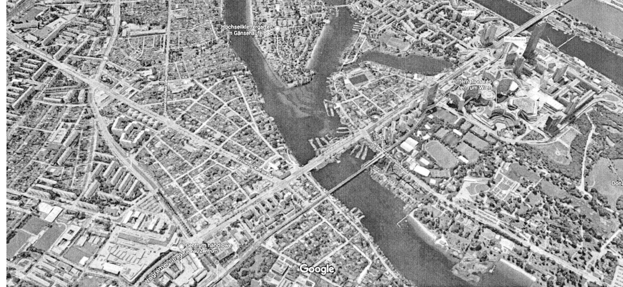
il. 1. Dunaj w Wiedniu. Zdjęcie lotnicze Google Maps / Danube River in Vienna

może to spowodować zniszczenie systemu wodnego ważnego dla łęgów naddunajskich. Wiedeńczycy mają nadzieję, że w trakcie konsultacji społecznych, podobnie jak z Łęgami tak i z tą inwestycją uda się rozwiązać sprawę zgodnie z zasadami zrównoważonego rozwoju, zachowując unikatowe wartości rejonu. Kilka istotnych informacji na temat zawartości i potencji zespołu wiedeńskiego nazwanego Zielonym Wiedniem. Na obszarze tym zajmującym 50 % terytorium miasta jest około 850 parków, wielki teren obejmujący Zielony Prater to 6 mln. m 2 powierzchni. Są też: ogród botaniczny z kilku tysiącami gatunków roślin alpejskich w ramach ogrodu alpejskiego, rezerwat biosfery Las Wiedeński o powierzchni 1350 km 2 z bogactwem gatunków roślin i zwierząt. W ramach terenów zielonych miasta, władze Wiednia podają liczbę zieleni wysokiej w ilości ponad 600 tysięcy drzew. [il.1.]