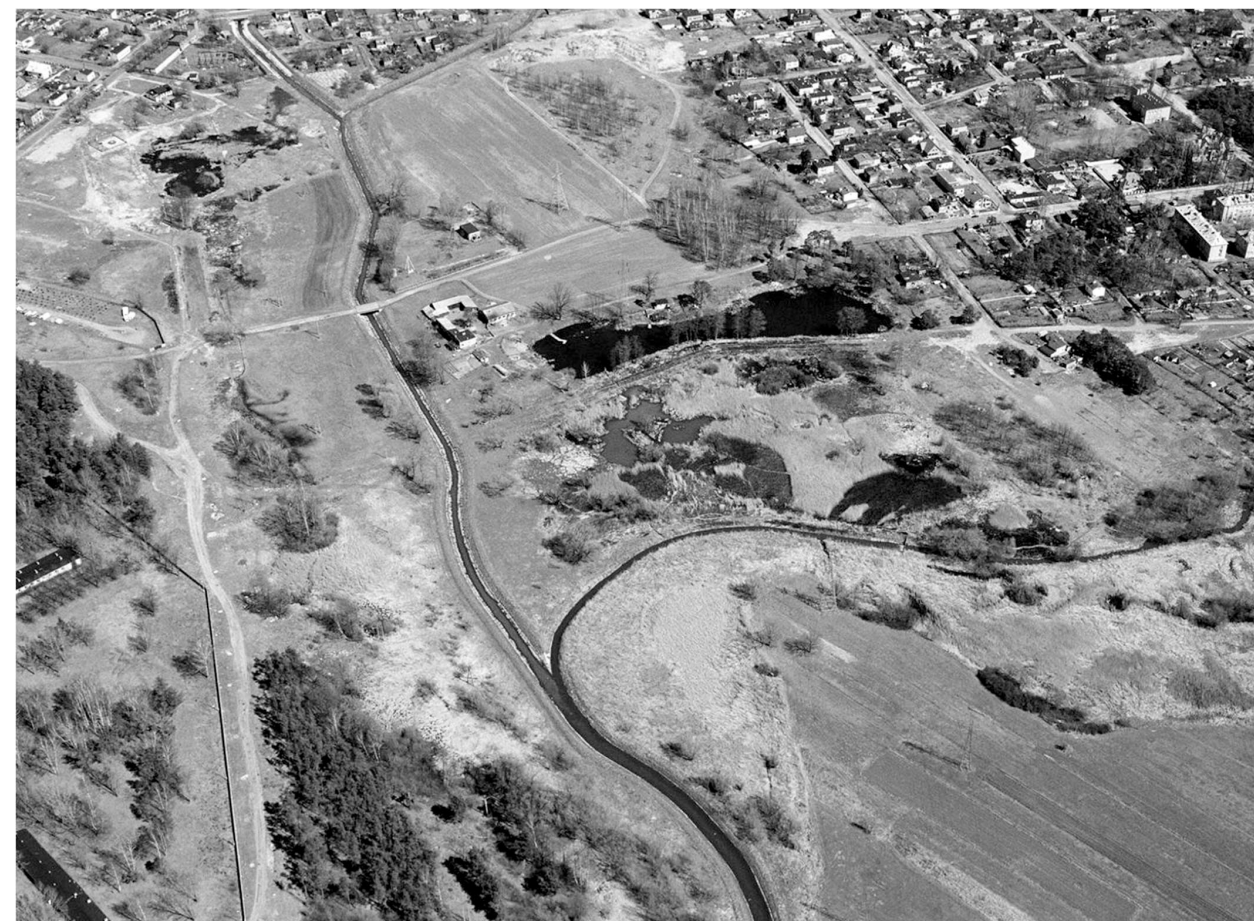
il. 3. Ner w Łodzi. Zdjęcie lotnicze / Ner River in Lodz