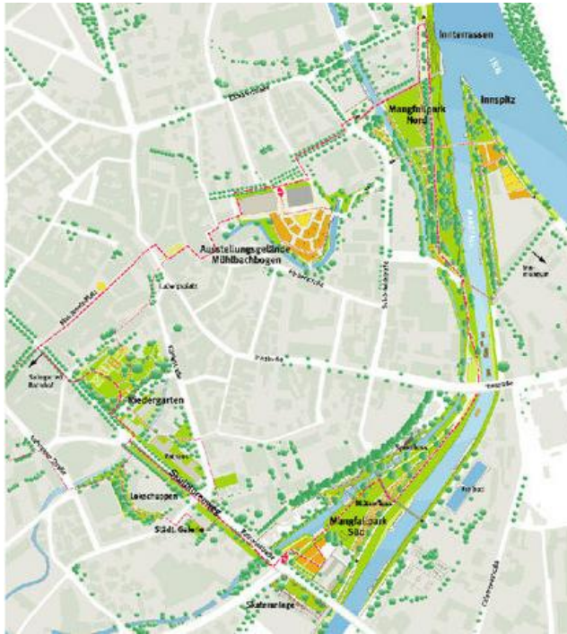
Il. 2 Teren LaGa 2010 Rosenheim