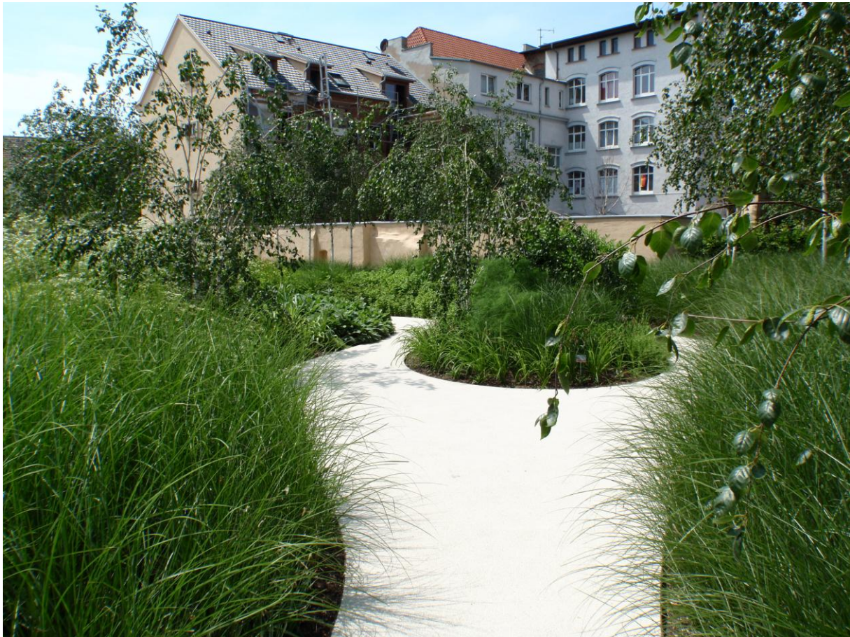
II. 3 Festiwale ogrodowe są pokazem kunsztu projektantów i miejscem testowania nowych technologii w architekturze krajobrazu. LaGa Aschersleben 2010