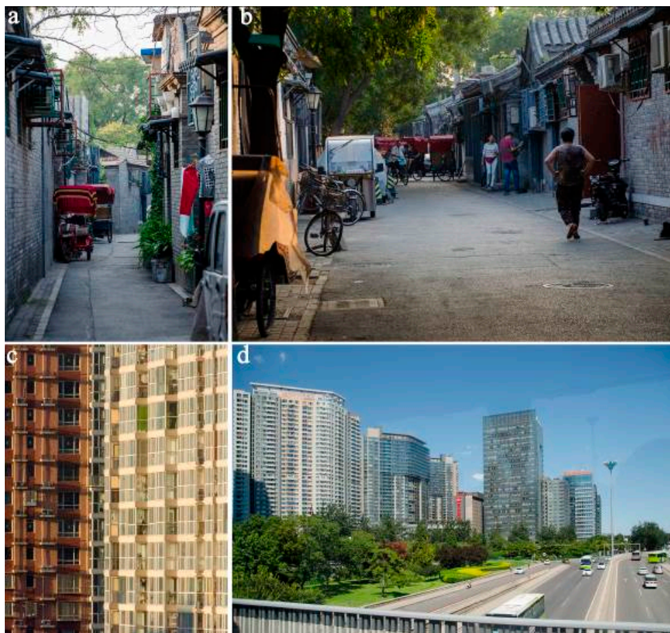
Il. 1. Przekształcenia krajobrazu w Pekinie dobrze ilustruje polityka kształtowania zabudowy mieszkaniowej

kapitalistycznego. Otwarcie rynku dla swobodnego przepływu kapitału oraz za- szczepienie zachodnich wzorców kształtowania przestrzeni miejskiej, zwłaszcza w odniesieniu do przestrzeni korporacyjno-biznesowych skutkowało niezwykle szybkimi przekształceniami w krajobrazie miasta. Powstały kolejne obwodnice, sze- rokie arterie obudowane wysoką zabudową – szklano-stalowymi wieżowcami. Przyśpieszyło także przekształcanie tradycyjnej zabudowy.