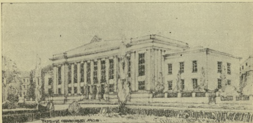
Nowy Gmach Biblioteki Politechniki Lwowskiej wybudowany w r. 1934.