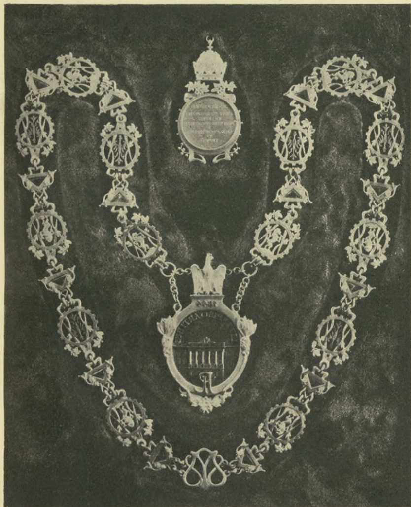
Złoty łańcuch Rektorski, ofiarowany Politechnice Lwowskiej w r. 1904 przez Polskie Towarzystwo Politechniczne i Galicyjską Izbę Inżynierską we Lwowie U góry pierwotny żeton (zakończenie) przy łańcuchu nowy żeton przerebiony w r. 1927.