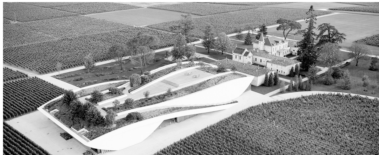
Il. 3. Winiarnia Château Margaux (Francja) (źródło: https://images.adsttc.com/media/images/557f/11c4/e58e/ce69/9600/0043/large.jpg/1868_FP542486_indesign.jpg?1434390968 , dostęp z dnia 20/01/2018) / Château Margaux Winery (France) (from: https://images.adsttc.com/media/images/557f/11c4/e58e/ce69/9600/0043/large.jpg/1868_FP542486_indesign.jpg?1434390968 , , accessed on 20/01/2018)