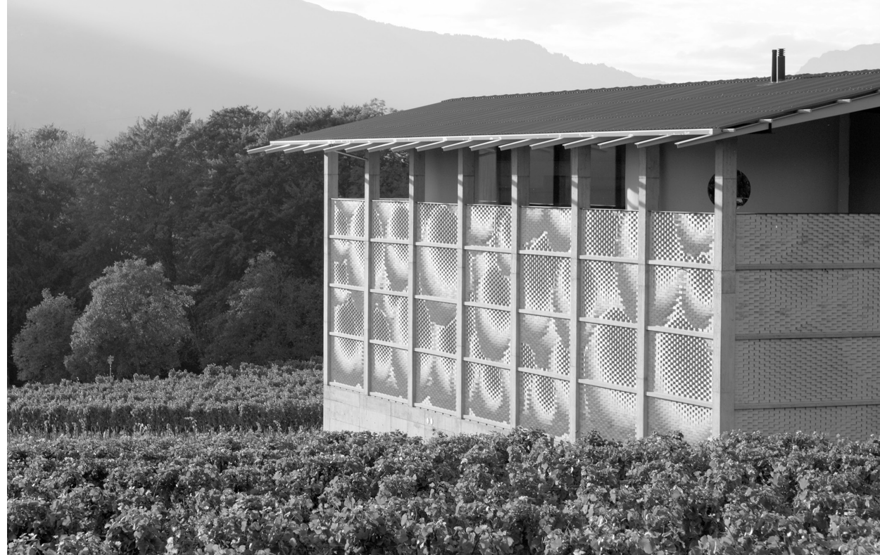
Il. 6. Winiarnia Gantenbein w Fläsch (Szwajcaria) / Gantenbein Winery in Fläsch (Switzerland)

Another example of using natural building materials is the Domaine Les Aurelles winery in Nizas, France. It was built entirely of solid limestone from