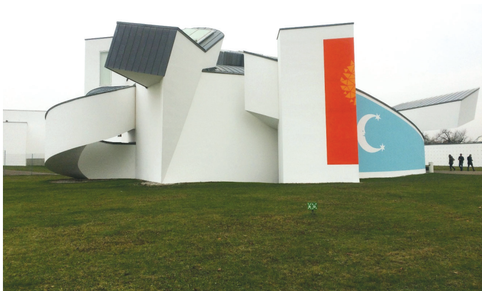
Il. 3. Vitra Design Museum, Frank Ghery