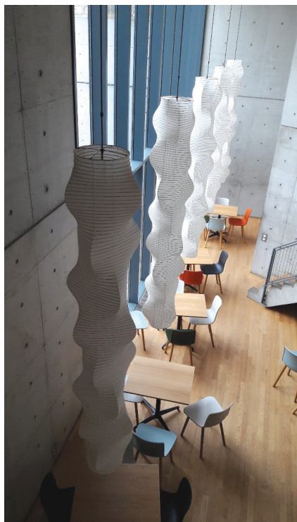
Il. 5. Pawilon konferencyjny Tadao Ando (wnętrze)