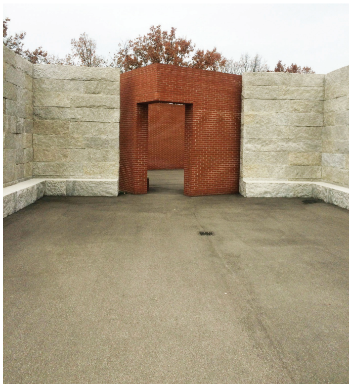
Il. 1. Promenade, Alvaro Siza