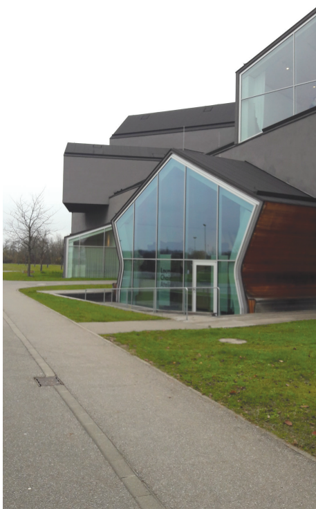
II. 7. Vitrahaus, Herzog&deMeuron