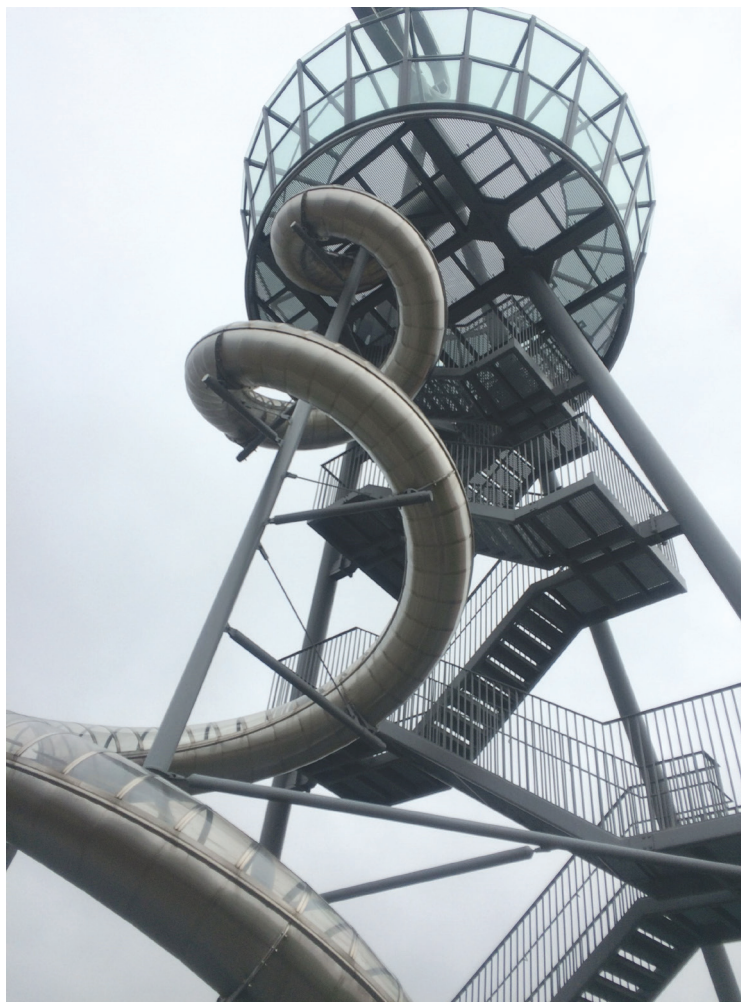
Il. 9. Vitra Slide Tower, Carsten Hller