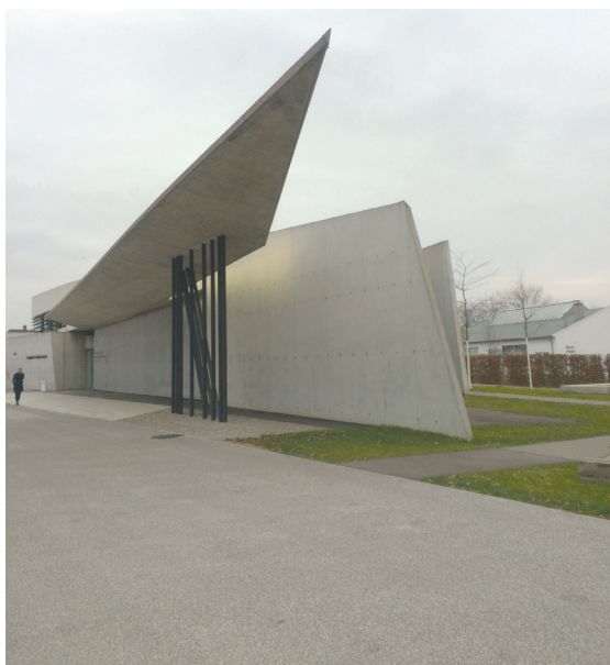
Il. 6. Fire Station, Zaha Hadid