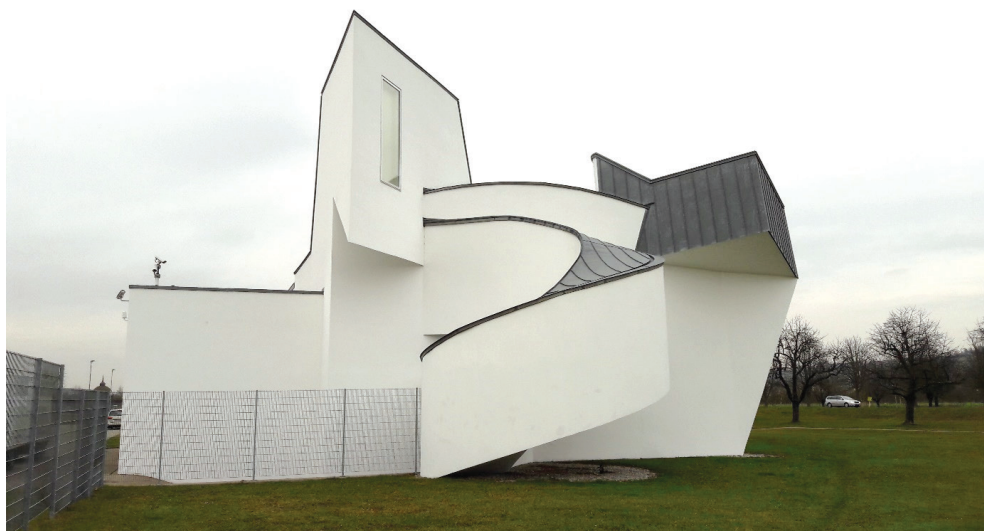
Il. 4. Vitra Design Museum, Frank Ghery