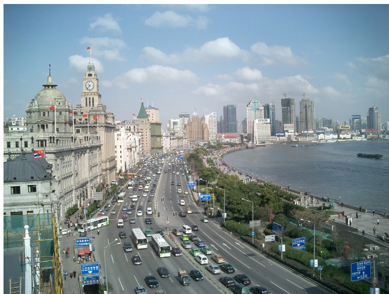
Il. 4. Koncesja międzynarodowa w Szanghaju, fragment promenady przy rzece w 2006 roku.