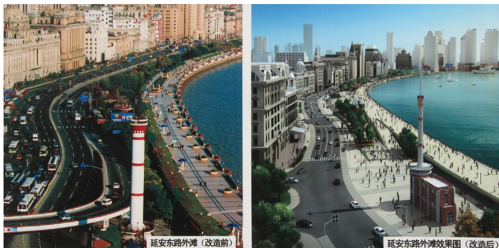
II. 5–6. Koncesja międzynarodowa w Szanghaju, fragment promenady przy rzece w 2008 i 2010 (po renowacji).