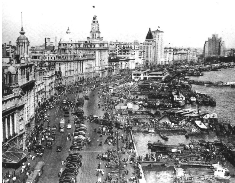
Il. 3. Koncesja międzynarodowa w Szanghaju, fragment promenady przy rzece w latach 30. XX wieku. Shanghai survey 1840s – 1940s, Jiangsu 1951