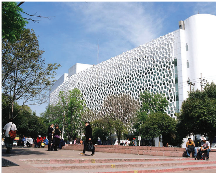
Il. 5. Szpital im. Manuela Gea Gonzaleza w Mexico City