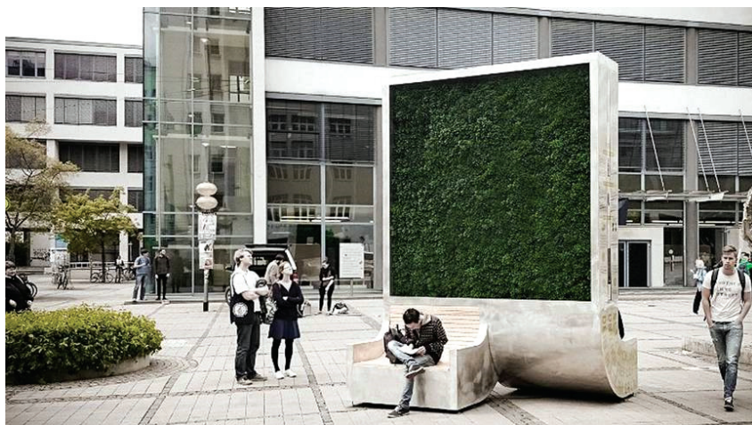
Il. 6. City Tree