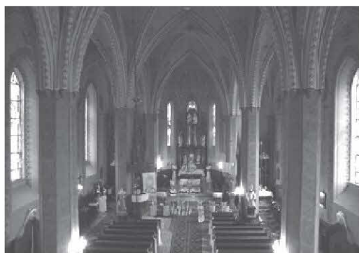
Rys. 1. Wnętrze kościoła w Zarszynie Fig. 1. Interior of the church in Zarszyn

Zaizolowanie okien będzie skutkowało zmniejszeniem infiltracji powietrza. Jednak uszczelnienie kościoła, w celu zwiększenia efektywności ogrzewania jest działaniem pozostającym w sprzeczności z potrzebą stałego przewietrzania wnętrza i usuwaniu pary wodnej oddawanej przez ludzi, zwłaszcza, że kościoły te często były projektowane na mniejszą ilość osób, niż ta która wynika z obecnego ich użytkowania. Przewietrzanie zabytkowego kościoła zaprojektowane było w ten sposób, że napływające przez nieszczelności okien i drzwi powietrze wylatywało przez otwory o średnicy ok. 0,2 m znajdujące się w sklepieniu nad nawą i prezbiterium. Na rysunku 1 pokazano wnętrze kościoła w Zarszynie, a na rysunku 2 widoczne otwory wentylacyjne w sklepieniu kościoła (rys. 3-4). Otwory te, w zależności od temperatury powietrza na zewnątrz, miały być pozostawione otwarte lub zamykane specjalnymi bloczkami. Zdarza się, że podczas remontu lub termomodernizacji kościoła otwory te są likwidowane i zatykane, aby zmniejszyć straty ciepła. Jest to błędne postępowanie, gdyż pogarsza naturalną wentylację kościoła, która gwarantuje, że cała kubatura kościoła zostanie przewietrzona i nie będzie miało miejsce zaleganie ciepłych mas powietrza pod sklepieniem. Przepływ powietrza przez 4 takie otwory w ciągu godziny, przy temperaturze zewnętrznej ok. 0°C może wynosić ok. 500 m 3 . Zatem otwory te powinno się zachować i najlepiej zabezpieczyć specjalnymi kominkami.