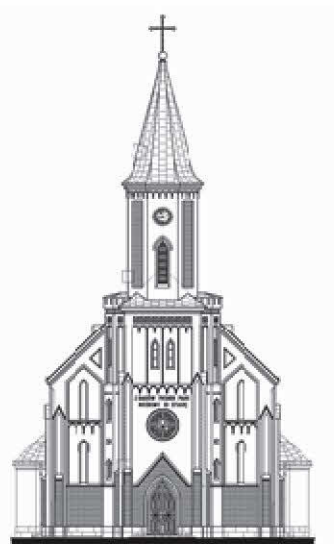
Rys. 3. Elewacja frontowa kościoła w Zarszynie

Fig. 3. The front facade of the church in Zarszyn