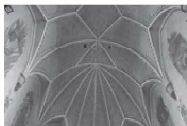
Rys. 2. Sklepienie kościoła z otworami wentylacyjnymi Fig. 2. The vaulted ceiling with air holes