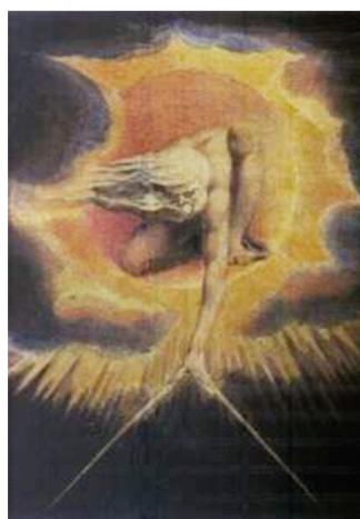
'God Creating the Universe', William Blake 1757–1827

Keywords: light – darkness, sensitivity, happiness, architecture, inner beauty.