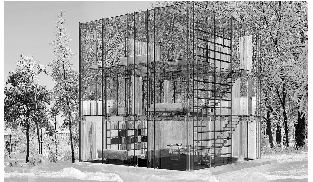
Il. 2. Szklany dom / The glass house. Author: Carlo Santambrogio, Ennio Arosio.