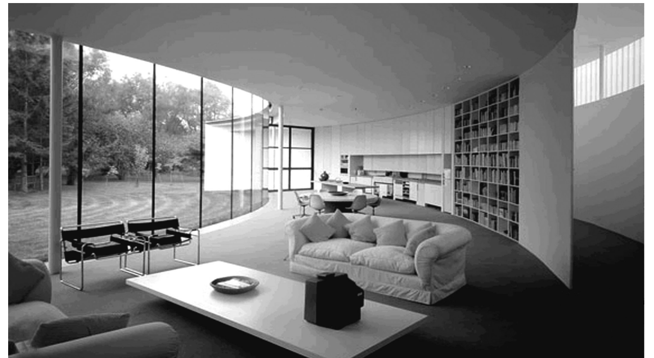
Il. 3. Crescent house. Author: Make Architect.