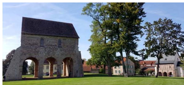
Ryc. 14. Widok na relikty opactwa w Lorsch obecnie od strony północno-wschodniej. Fot. autorzy, 2016

In conclusion, one can say that the early-medieval monastery complex in Lorsch was given a new lease of life after it had been included in the cultural tourist route of Hessen. As a tourist attraction focusing the interest of numerous groups of visitors from all over the world, that modern museum complex also enhances the economic development of the town itself, e.g. by creating new workplaces. It is worth noticing the fact that the complex