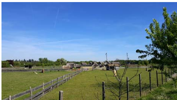
Ryc. 17. Widok na park archeologiczny „Lauresham” obecnie od strony południowo-wschodniej.

Fig. 16. View of the relics of the Lorsch abbey nowadays from the south-east.