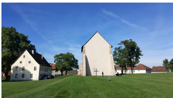
Ryc. 15. Widok na relikty opactwa w Lorsch obecnie od strony południowo-wschodniej. Fot. autorzy, 2016

is still developing. Recently a so called “cultural axis” has been created here, which is a combination of relics of the Benedictine abbey with the site where the Altenmünster used to stand. Such a route is intended to enable tourists to visit the Altenmünster and ensure a connection with the “Lauresham” archaeological park. All the architectural elements, archaeological relics and cultural items located along the “axis” have been properly highlighted and described by means of information boards. Owing to such activities and appropriate promotion, the cultural complex in Lorsch has been given an opportunity to become one of the most fascinating open-air museum spaces of that type in Europe.