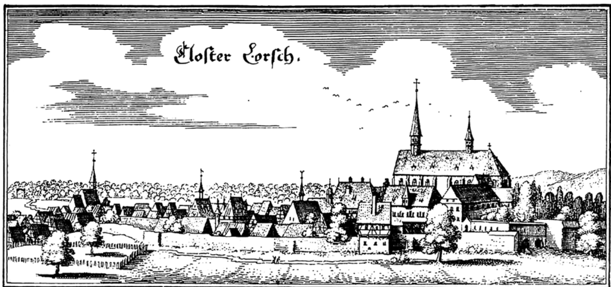
Ryc. 2. Widok Lorsch na sztychu Mateusza Meriana z 1. połowy XVII wieku. Kopia w archiwum Katedry Historii Architektury, Urbanistyki i Sztuki Powszechnej Wydziału Architektury Politechniki Krakowskiej, s.v.

The former abbey and Altenmünster monastery complex in Lorsch was inscribed into the UNESCO World Heritage List in 1991. In the justification of the inscription the applicant stated that the former Benedictine abbey in Lorsch, particularly considering the “Torhalle” gate, fulfils the requirements of being entered into the UNESCO List. The “Torhalle” is over 1200 years old and besides the Gothic roof has remained practically unchanged, which makes it one of the best preserved examples of Carolingian architecture in Europe. Against the background of the abandoned monastic complex that was largely destroyed during the Thirty-Year War 3 ,