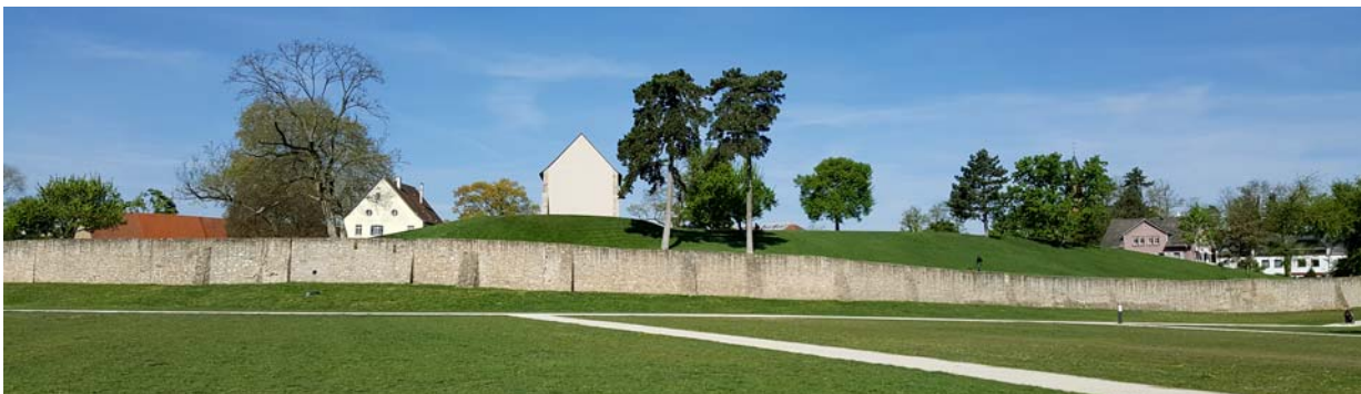
Ryc. 12. Widok na zachowany fragment muru zespołu klasztorowego od strony południowej.

Fig. 12. View of the preserved fragment of the monastery complex wall from the south.