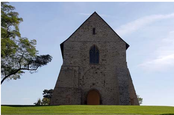
Ryc. 10. Widok na zachowany fragment kościoła św. Nazariusza od strony północno-zachodniej.

Fig. 10. View of the preserved fragment of the St. Nazarius church from the north-west.