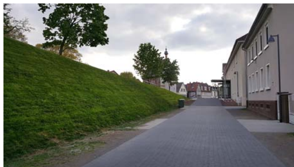
Ryc. 18. Widok na fragment „osi kulturowej” od strony północno-wschodniej.

Fig. 17. View of the “Lauresham” archaeological park nowadays, from the south-east.