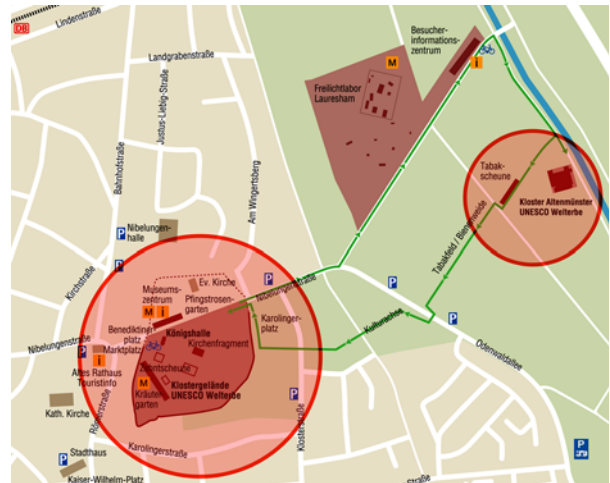
Ryc. 3. Plan Lorsch z zaznaczeniem dwóch głównych elementów kompleksu klasztorowego. Plan [w:] Muzeum Lorsch

Zespół dawnego opactwa i klasztoru Altenmünster z Lorsch został wpisany na Listę Światowego Dziedzictwa UNESCO w 1991 roku. W uzasadnieniu do wpisu wnioskodawca zaznaczył, że dawne opactwo benedyktynów w Lorsch, szczególnie biorąc pod uwagę bramę „Torhalle”, spełnia wymogi wpisu na Listę UNESCO. „Torhalle” ma ponad 1200 lat i oprócz gotyckiego dachu, praktycznie nie była przebudowywana, co sprawia, że jest jednym z najlepiej zachowanych przykładów architektury karolińskiej w Europie. Na tle opuszczonego kompleksu klasztorowego, który w dużej części znisz-