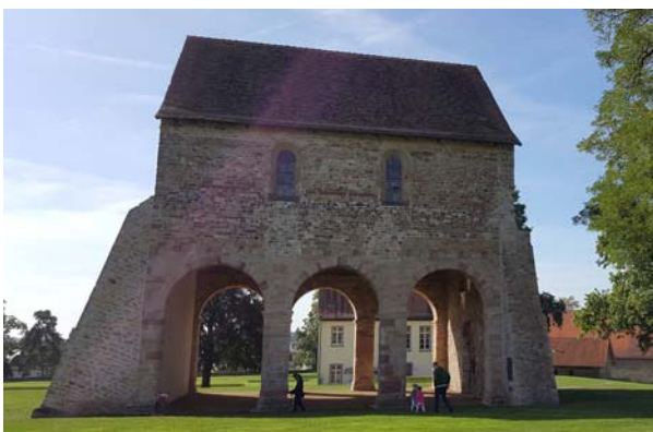
Ryc. 11. Widok na zachowany fragment kościoła św. Nazariusza od strony północnej. Fot. autorzy, 2016

Fig. 10. View of the preserved fragment of the St. Nazarius church from the north-west. Photo: authors, 2016