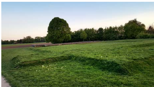
Ryc. 5. Widok na teren, gdzie w okresie wczesnego średniowiecza zlokalizowany był klasztor Altenmünster.

Fig. 5. View of the site where the Altenmünster monastery was located in the early medieval period.