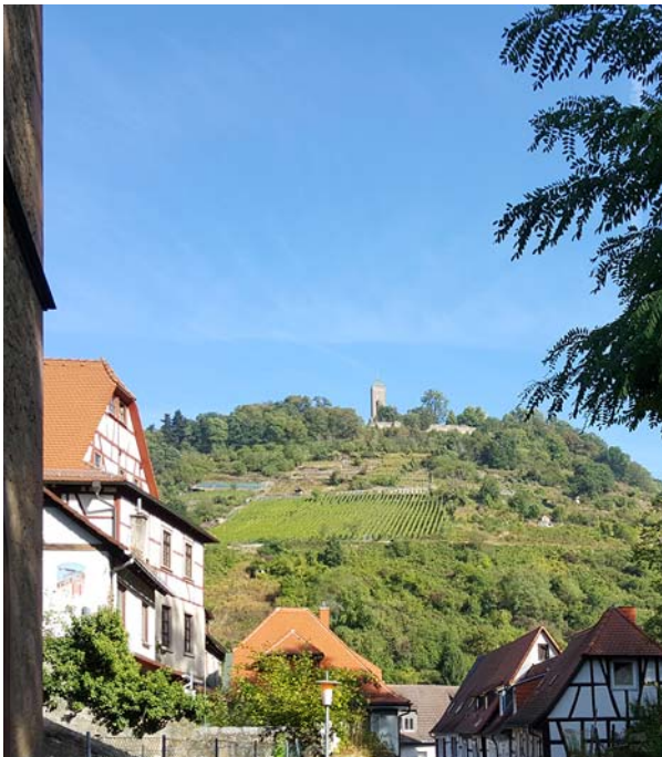
Ryc. 7. Widok na górujący nad Heppenheim zamek Starkenburg.

Fig. 7. View of the Starkenburg castle overlooking Heppenheim.