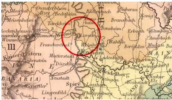
Ryc. 1. Fragment archiwalnej mapy Niemiec z 1854 roku autorstwa A. Blacka, Ch. Blacka, S. Halla i W. Hughes, na której zaznaczono lokalizację miasta Lorsch. Kopia mapy [w:] Archiwum Katedry Historii Architektury, Urbanistyki i Sztuki Powszechnej Wydziału Architektury Politechniki Krakowskiej, s.v.