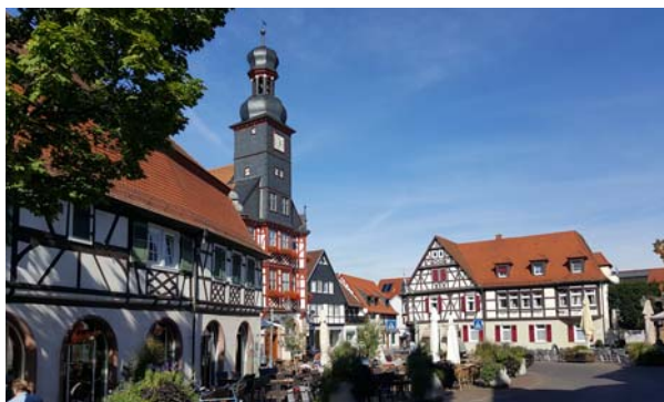
Ryc. 9. Widok na centrum Lorsch.

Najcenniejszymi elementami krajobrazu kulturowego Lorsch są: miasto, które rozwinęło się przy opactwie w okresie średniowiecza, oraz relikty zespołu klasz-