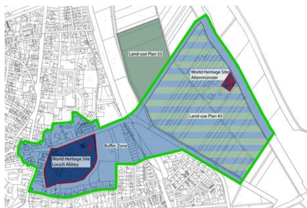
Ryc. 4. Mapa granic terenu objętego ochroną konserwatorską w związku z wpisem na Listę UNESCO zespołu klasztornego w Lorsch. Oprac. Autorzy z wykorzystaniem mapy ujętej w dokumentacji UNESCO. Oryginał [w:] http://whc.unesco.org , dostęp: 22.03.2017. Kolorem zielonym oznaczono granice terenu objętego wpisem. Kolorem czerwonym zaznaczono obiekty, których dotyczy wpis: I – opactwo Lorsch, II – Altenmünster

Fig. 5. View of the site where the Altenmünster monastery was located in the early medieval period. Photo: authors, 2017