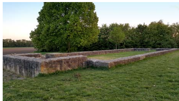
Ryc. 6. Widok na relikty klasztoru Altenmünster w Lorsch.

The history of the Lorsch complex started in the year 764 when a Frankonian count Concor and his mother Williswinda founded Altenmünster. The monastery was erected on a private estate, which ensured its founders e.g. the right to appoint the vicar in the local church. The original complex comprised the church which was to be the necropolis of its founders, and monastery buildings, most probably wooden. The abbey was dedicated to St. Peter and Paul, and its first abbot was Chrodegang (764–765), the then archbishop of Metz, a relative of the abbey founders, who was entrusted the care of the whole complex. In the following years Concor endowed the new monastery with further donations, and the abbot Chrodegang obtained from Pope Paul I the body of St. Nazarius, a martyr from the times of Diocletian,