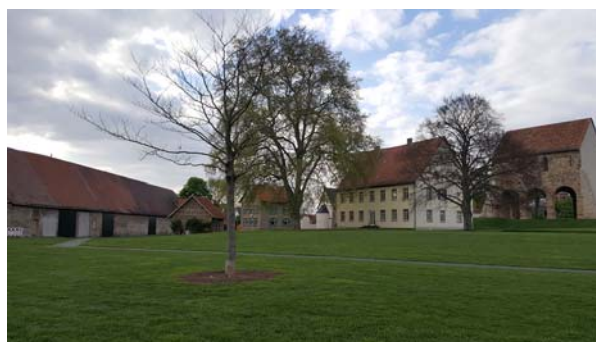
Ryc. 16. Widok na relikty opactwa w Lorsch obecnie od strony południowo-wschodniej. Fot. autorzy, 2017

Fig. 15. View of the relics of the Lorsch abbey nowadays from the south-east. Photo: authors, 2016