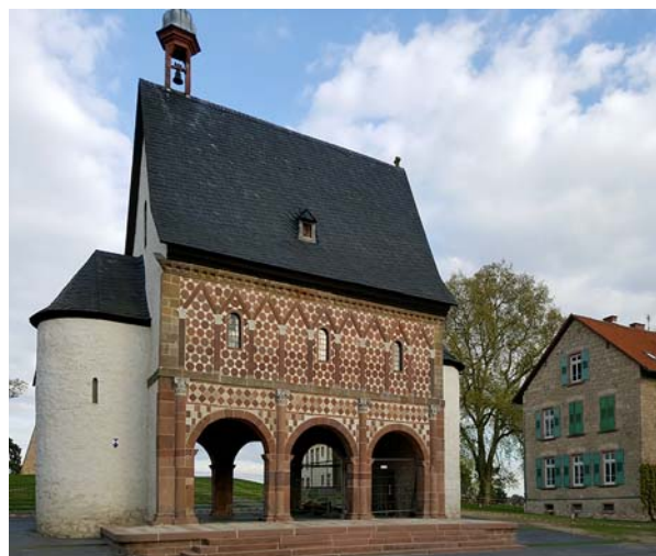
Ryc. 13. Widok na zachowaną „Torhalle” od strony zachodniej. Fot. autorzy, 2017

Podsumowując można stwierdzić, że wczesnośredniowieczny kompleks klasztorny w Lorsch dzięki włączeniu go w szlak turystyki kulturowej Hesji zyskał drugie życie. Jako atrakcja turystyczna skupiająca zainteresowanie licznych grup zwiedzających z całego świata ten nowoczesny kompleks muzealny wspomaga także rozwój gospodarczy samego miasta, tworząc m.in. nowe miejsca pracy. Warto zwrócić uwagę na fakt, że