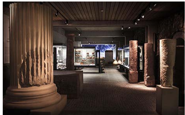
Ryc. 8. Wnętrze Lobdengau-Museum. Fig. 8. Interior of the Lobdengau-Museum.

się w jeden z najważniejszych ośrodków rzymskich na wschód od Renu z własnym forum, bazyliką oraz teatrami. Hegemonia rzymska w Ladenburgu trwała do połowy V stulecia 1 .