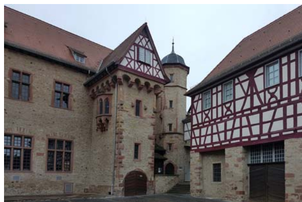
Ryc. 13. Fragment zespołu budynków dawnego Sądu Elektoratu Moguncji.

Fig. 12. Starkenburg Castle.