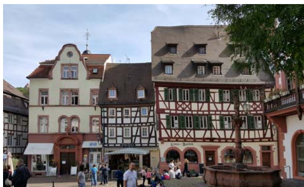
Ryc. 20. Historyczna zabudowa przyrynkowa. Fot. autor, 2016 Fig. 20. Historic buildings near main square. Photo: author, 2016

Ważnym obiektem zabytkowym Weinheim jest obecny ratusz, zlokalizowany w dawnym zamku – siedzibie Elektora Palatyńskiego. Obiekt powstawał etapami. Jego najstarsza część – łuk, który tworzy górną bramę wejściową – datowany jest na 1400 rok, a kolejne można wiązać z okresem renesansu, baroku i wiekiem XIX, kiedy do korpusu budynku dobudowano neogotycką wieżę. Przy zamku znajduje się zabytkowy park, w którym zachowały się relikty średniowiecznych murów obronnych, z których najstarsze fragmenty pochodzą z 2. połowy XIII wieku.