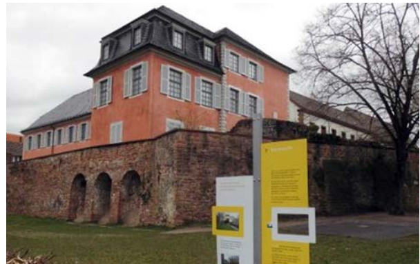
Ryc. 7. Widok na budynek Lobdengau-Museum. Fig. 7. View of Lobdengau-Museum.