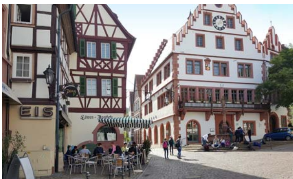
Ryc. 19. Dawny ratusz w Weinheim. Fig. 19. Old town hall in Weinheim.