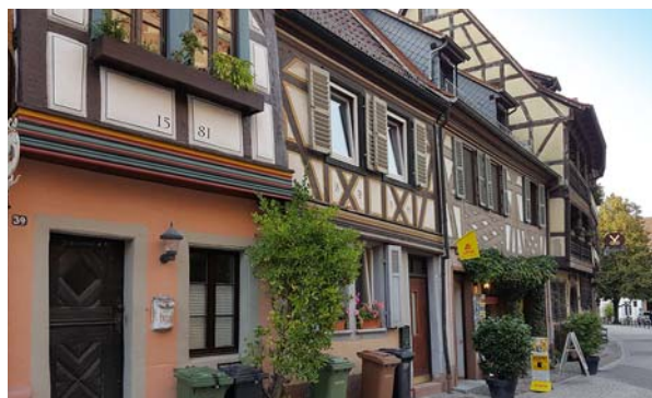
Ryc. 4. Zabytkowa zabudowa miasta.

Fig. 3a–b. View of the main square in Ladenburga.