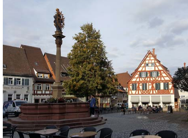
Ryc. 3a–b. Widok na główny plac Ladenburga. Fot. autor, 2016

Fig. 3a–b. View of the main square in Ladenburga. Photo: author, 2016