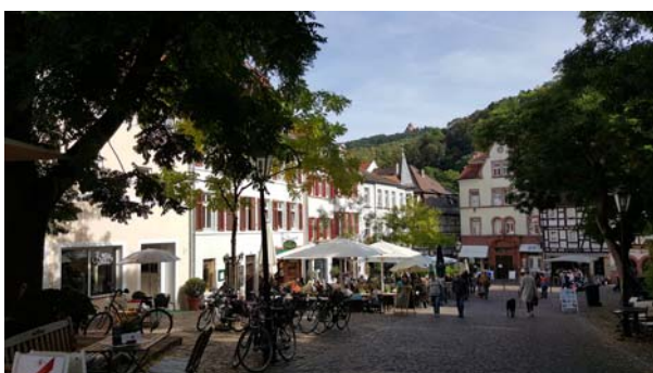
Ryc. 17. Fragment rynku w Weinheim. Fot. autor, 2016 Fig. 17. Fragment on the main square in Weinheim. Photo: author, 2016