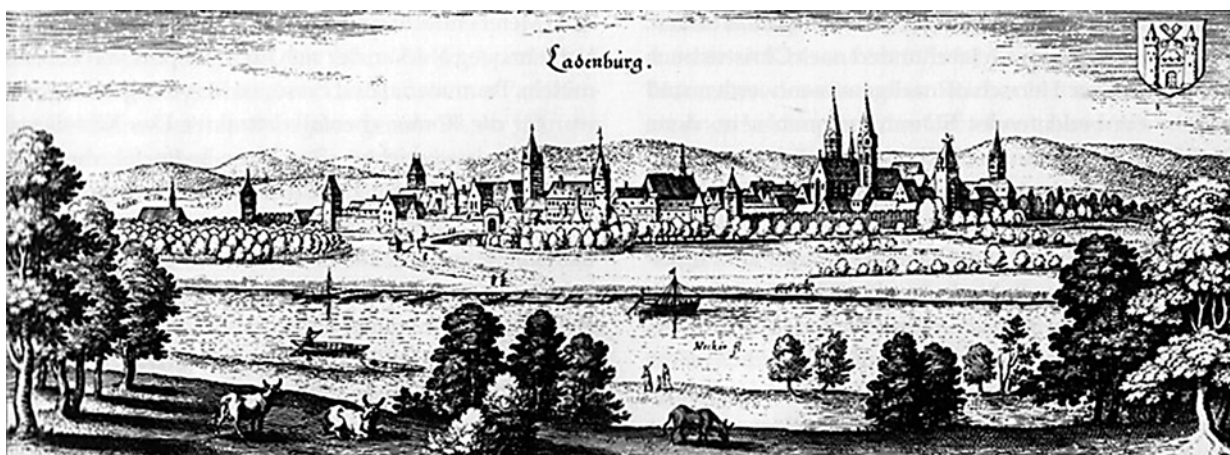
Ryc. 2. Ladenburg na sztychu Mateusza Meriana z 1. połowy XVII wieku. Kopia w archiwum Katedry Historii Architektury, Urbanistyki i Sztuki Powszechnej Wydziału Architektury Politechniki Krakowskiej, s.v.

Around 40 A.D. a Roman military camp was established here on the river Neckar. In 98 A.D., Emperor Trajan called it „Lopodunum” which must have influenced the later name of the town. During the next two centuries