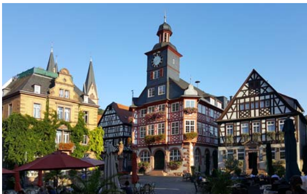
Ryc. 10. Rynek z ratuszem w Heppenheim. Fot. autor, 2016

Fig. 10. Main square with town hall in Heppenheim. Photo: author, 2016