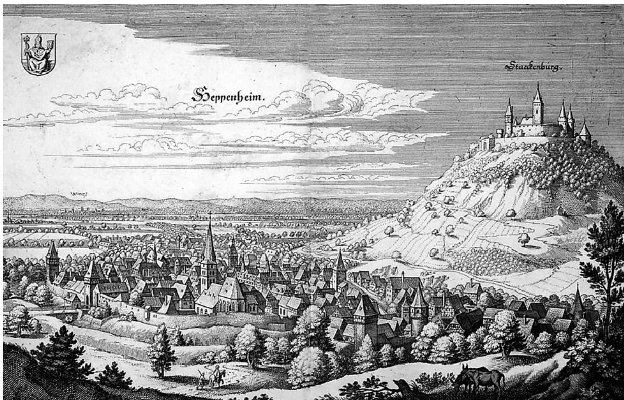
Ryc. 9. Heppenheim na sztychu Mateusza Meriana z połowy XVII wieku. Kopia w archiwum Katedry Historii Architektury, Urbanistyki i Sztuki Powszechnej Wydziału Architektury Politechniki Krakowskiej, s.v.

The second town worth describing in the context of this article is Heppenheim, located to the north of Ladenburg. It is a small town which currently has 25 thousand inhabitants. The town, however, can boast a colourful and eventful history, and valuable cultural resources that are appropriately protected, but primarily properly exhibited and used.