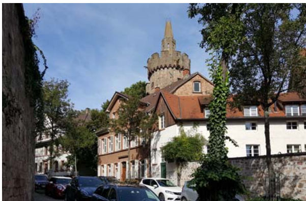
Ryc. 15. Zabytkowa zabudowa miasta. Fot. autor, 2016 Fig. 15. Historic town buildings. Photo: author, 2016