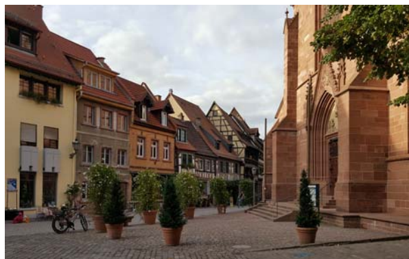
Ryc. 5. Zabytkowa zabudowa miasta oraz fragment elewacji frontowej kościoła parafialnego pw. św. Gawła.

Fig. 4. Historic town buildings.