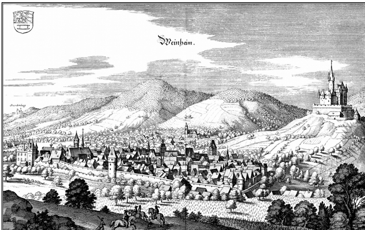
Ryc. 14. Weinheim na sztychu Mateusza Meriana z 1. połowy XVII wieku. Kopia w archiwum Katedry Historii Architektury, Urbanistyki i Sztuki Powszechnej Wydziału Architektury Politechniki Krakowskiej, s.v.

The urban structure of the town, like in the two previously described centres, is quite irregular with an elongated, rectangular market square, slightly resembling Strassenmarkt. The former town hall, whose ground floor built in the mid-16 th century served as an open market hall, while the first floor was used for official purposes, stands in the market square.