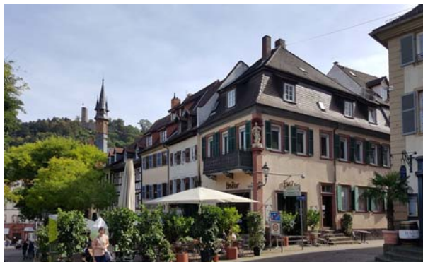
Ryc. 16. Zabytkowa zabudowa miasta. Fig. 16. Historic town buildings.