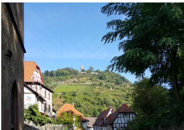
Ryc. 12. Zamek Starkenburg.

Fig. 11. Historic town buildings.