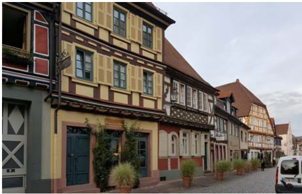
Ryc. 6a–b. Zabytkowa zabudowa miasta. Fig. 6a–b. Historic town buildings.