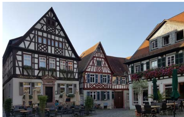
Ryc. 11. Zabytkowa zabudowa miasta. Fot. autor, 2016

Fig. 10. Main square with town hall in Heppenheim. Photo: author, 2016