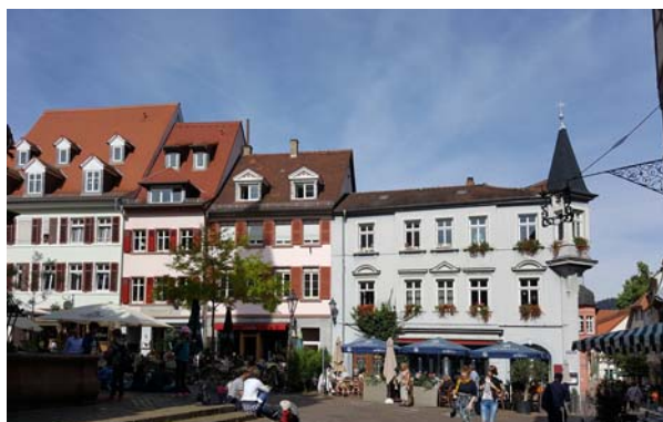
Ryc. 18. Historyczna zabudowa przyrynkowa. Fig. 18. Historic buildings near main square.