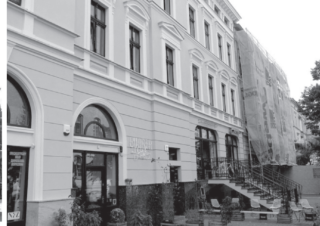
il. a-b. Ulica Gimnazjalna przed rozpoczęciem działalności grupy i w trakcie. Aktywność użytkowników parterów kamienic zmotywowała właścicieli do remontów. Obecnie cała pierzeja ulicy jest po renowacji / Gimnazjalna Street before beginning the work of the group and then, during it. Activity of the users of ground floors had motivated the owners to perform renovations. Currently, the entire frontage is after renovation

Współpracujące ze sobą podmioty kierują ofertę do szerokiego grona odbiorców, bez wyraźnego profilu.