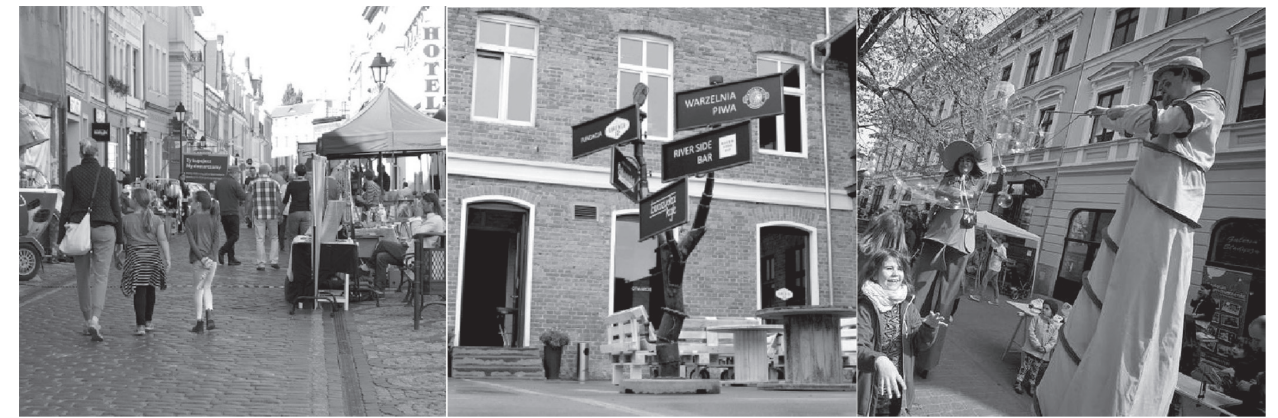
il. 1. Lokalne społeczności aktywne w wybranych lokalizacjach / Local societies being active in chosen places Fot. a. Ulica Długa, Fot. b. Kamienica 12 , Fot. c. Ulica Gimnazjalna fot. Autorka / Photo a. Długa Street, photo b. Kamienica 12 , Phptp c. Gimnazjalna Street, photo by the author

Długa Street is a main historical high road of the Old Town, previously limited with city gates: Kuyavian and Pomeranian, with a preserved 18 th and 19 th century architecture with previous relicts. Social activity around this space focuses around two entities: Local Organization of Bydgoszcz BYLOT and Society Bydgoska Starówka . Local Tourism Organization of Bydgoszcz BYLOT 15 was created in 2006. The organization bases its activities on consolidation of various societies e.g. entrepreneurs, cultural institutions, restaurant owners, hoteliers and local government in order to cooperate for social-economic development of the city and the region. BYLOT attempts to organize public events, that aim for building citizens' identity and promot-