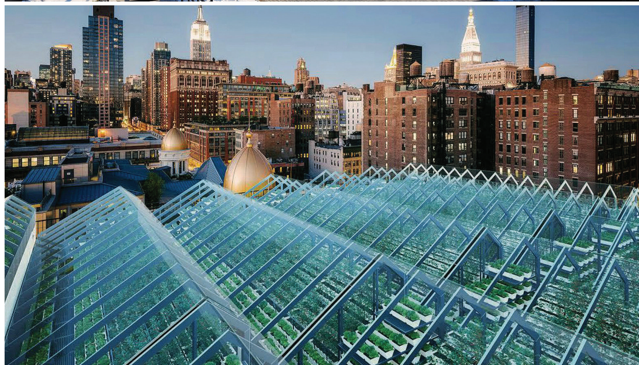
il. 2. Miejska farma pionowa w nowojorskim Brooklynie. / City vertical farm in New York Brooklyn.