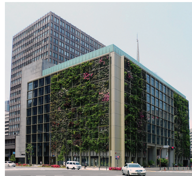
il. 3. Budynek i wnętrza miejskiej farmy pionowej, siedziby korporacji rekrutacyjnej w Tokio. / The building and interior of the urban vertical farm, the headquarters of the recruiting corporation in Tokyo.