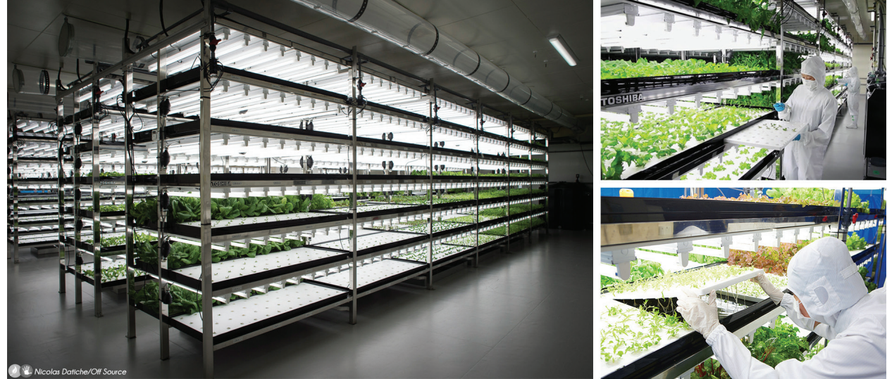
il. 5. Sterylne pomieszczenia miejskiej farmy pionowej w Yokosuka. / Clean rooms in the vertical farm in Yokosuka.