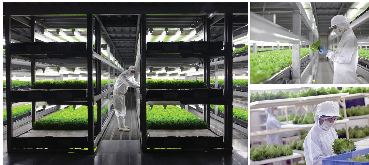
il. 6. Fabryka żywności w Kameoka, Japonia. Sałata uprawiana hydroponicznie przy użyciu cyklicznego oświetlania lampami LED. / Food factory in Kameoka, Japan. Lettuce is grown hydroponically using timed doses of LED light.

umieszczone na półkach-tacach dziewięciopoziomowych regałów docelowo mają dawać plony w wysokości 3 mln sztuk warzyw rocznie z ok. 1 950 m 2 powierzchni upraw. Większość półek oświetlana jest świetłówkami. Część upraw poddawana jest badaniom dotyczącym wpływu różnych barw światła lamp LED na ich jakość i tempo wzrostu 9 .