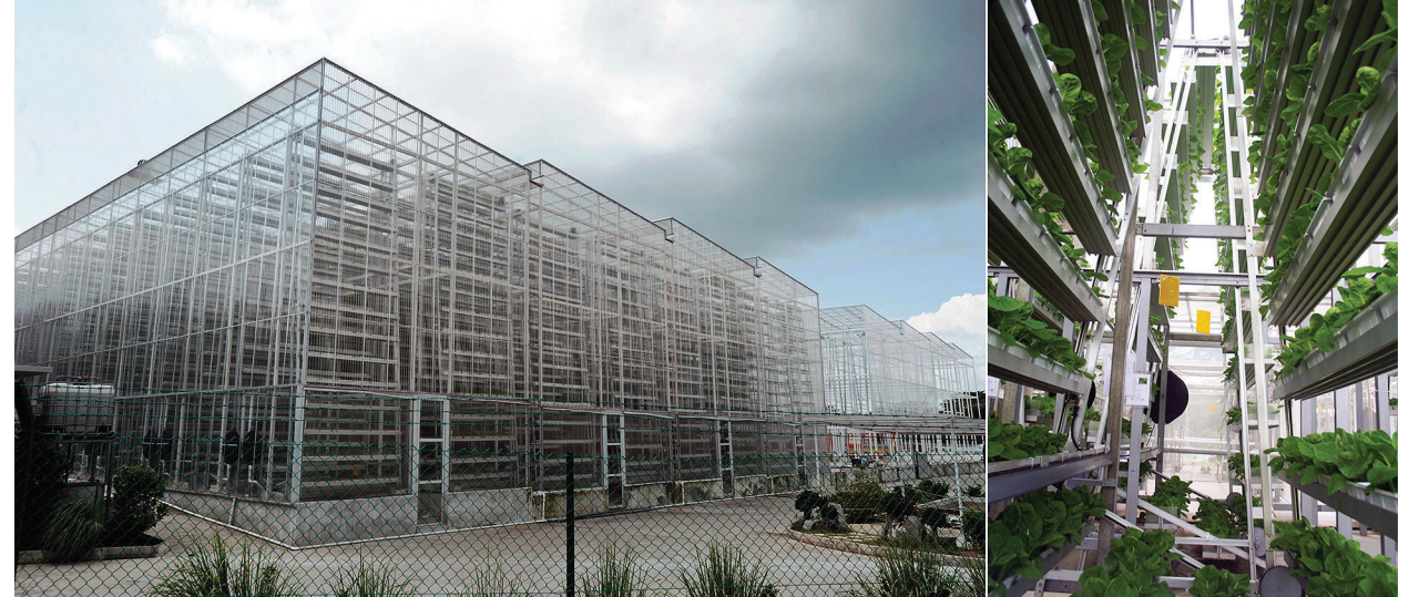
il. 1. Miejska farma pionowa w Singapurze. / City vertical farm in Singapore.

Growth of plants with a predominance of access to natural sunlight occurs in those vertical farms which have been adapted to ensure natural environmental conditions or conditions as close as possible to the natural conditions. In order to ensure the plants' optimal access to daylight, systems of mobile shelves are used, shifted to various positions using appropriate control systems. Such a technology has been utilized in the experimental facility in the Paignton Zoo Environmental Park, the first vertical farm implemented in the 21st century in accordance with the principles of modern urban agriculture, and completed in 2009 1 . The technology used in a commercial farm established in 2012 in Singapore provides the plants with even access to sunlight by placing them on mobile shelves (il. 1). The hydraulic systems applied in this case