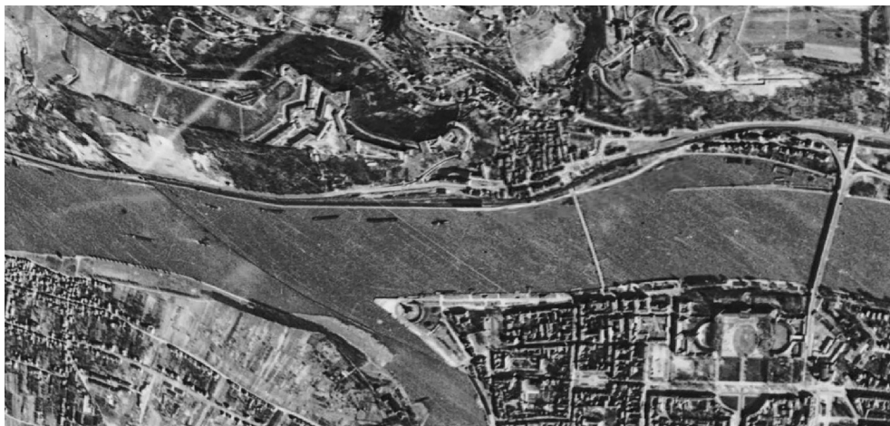
II. 1. Zdjęcie lotnicze z okresu II wojny światowej – pierwsze zniszczenia

III. 1. Aerial photograph of the World War II period – first destructions