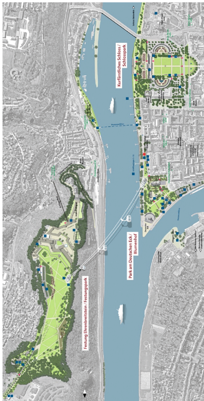
II. 7. Plan BUGA 2011