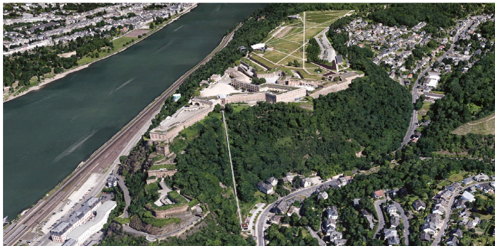
II. 4. Widok od północy na płaskowyż twierdzy Ehrenbreitstein