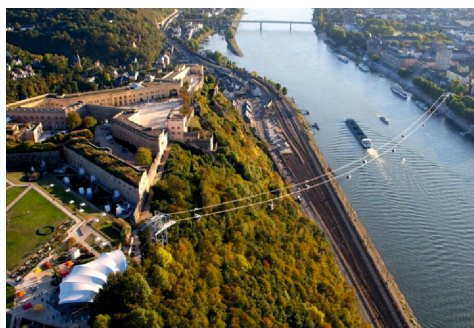
II. 5. Widok z lotu ptaka od południa