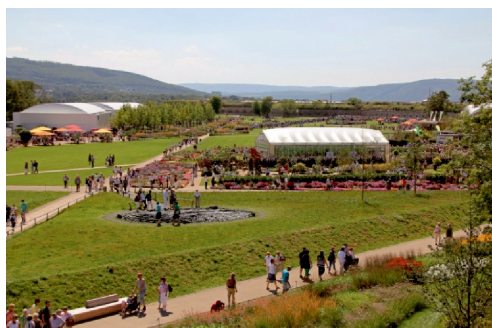
II. 6. Widok z BUGA 2011