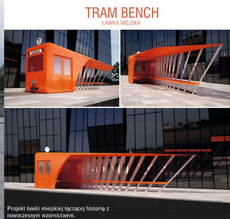
II. 2. Ring, proj. A. Cichosz (realizacja 2016), Tram Bench, proj. M. Walczak, w trakcie realizacji, (materiały autorki)