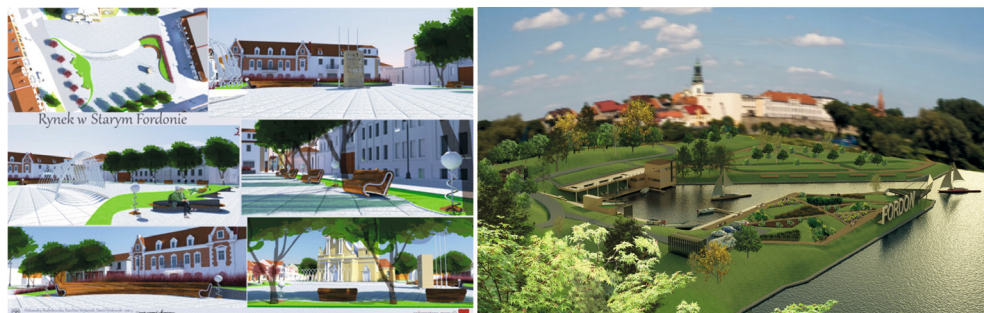
II. 3. Stary Fordon – projekty studenckie 2016 (materiały autorki)