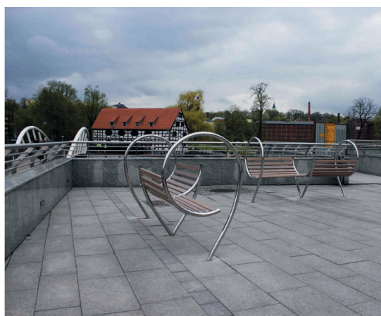
III. 1. A. Bożek, K. Kulik, Stary Rynek's plate design