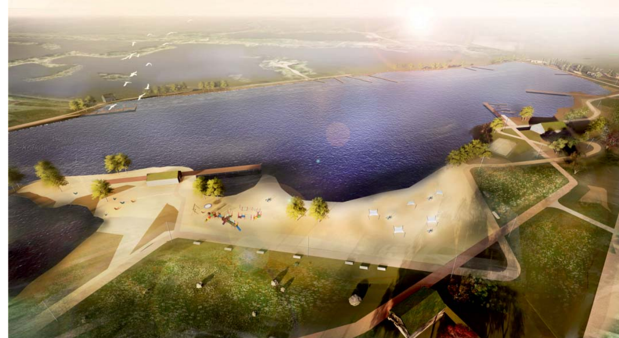
Il. 5. Zagospodarowanie, widok z lotu ptaka od strony południowo-wschodniej, proj. MTWW Architekci / The site arrangement from a birds-eye view from the south-eastern side, design by MTWW Architekci

City 13 . Przyszła realizacja ma na celu promowanie ekologicznego i aktywnego spędzania czasu oraz edukowanie w zakresie wiedzy o nadwiślańskiej florze i faunie. Dlatego projekt, odnosi się do związku między człowiekiem, jego działalnością a naturą.