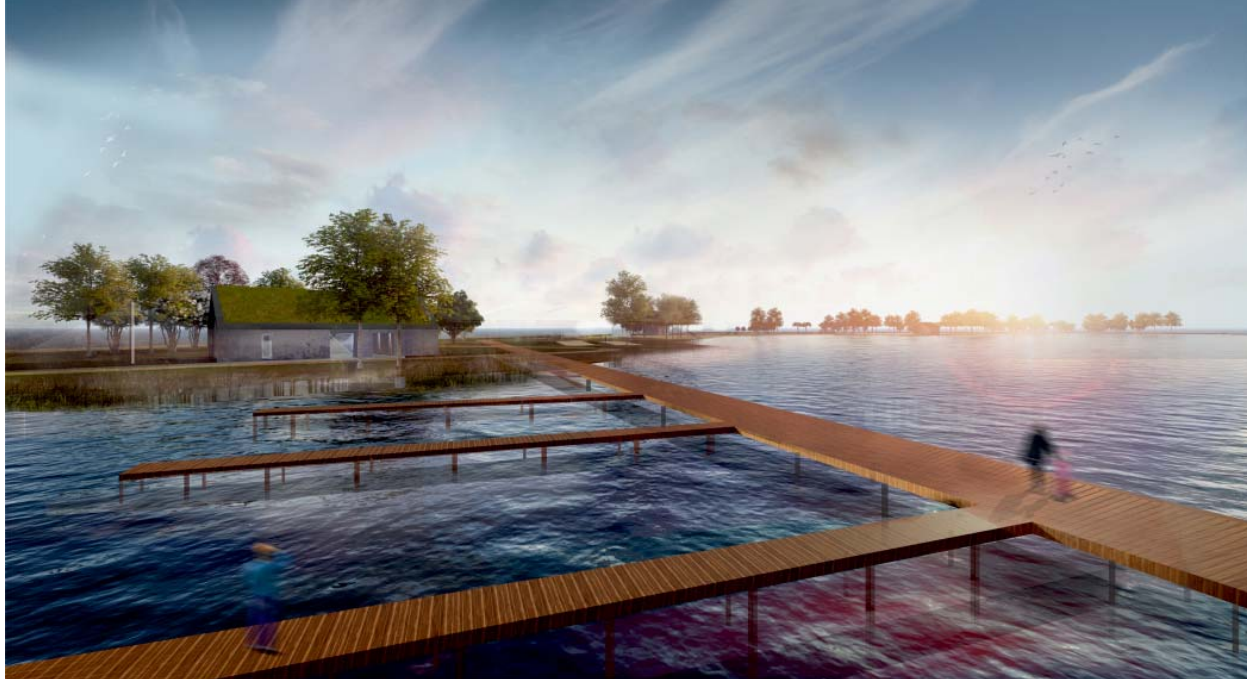
Il. 8. Widok na pomost cumowniczy, proj. MTWW Architekci / A view of the jetty, design by MTWW Architekci

widuje się montaż kamer monitoringu na wybranych słupach oświetleniowych oraz elewacjach budynków. Monitoring obiektów oparty będzie na bazie kamer IP. W budynkach zainstalowana będzie instalacja kontroli dostępu. Kontrola dostępu ma na celu niedopuszczenie osób nieupoważnionych do wejścia w obszary przeznaczone dla pracowników i ochrony. Całość podłączona będzie do miejskiego systemu monitoringu i policji.