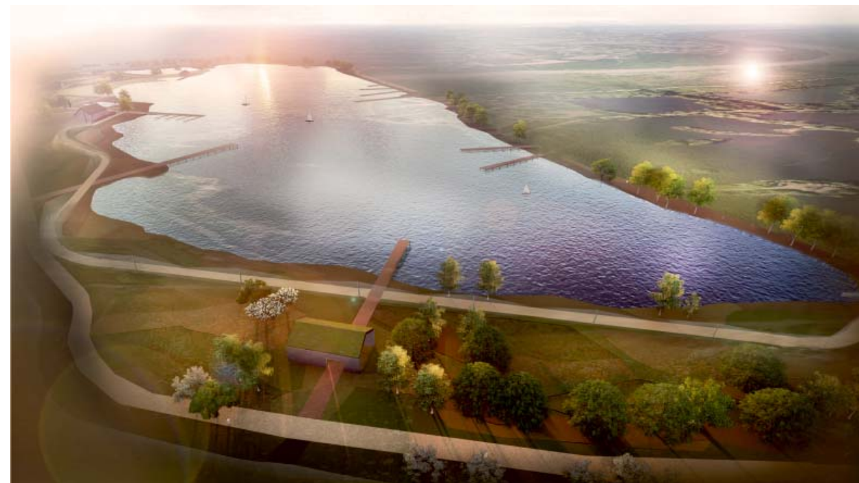
Il. 6. Zagospodarowanie, widok z lotu ptaka od strony północnej, proj. MTWW Architekci / Site arrangement seen from a birds-eye view from the north, design by MTWW Architekci

The greenery design was based on recreating the natural swaths of original greenery, as well as a combination thereof. The species proposed in the design are characterized by good resistance to temporary flooding of the root system. These are tall and medium-height greenery species, as well as decorative grasses counted among domestic plants. Flowery meadows will be one of the site's attractions in terms of greenery. They function well in difficult habitat conditions, constituting a haven