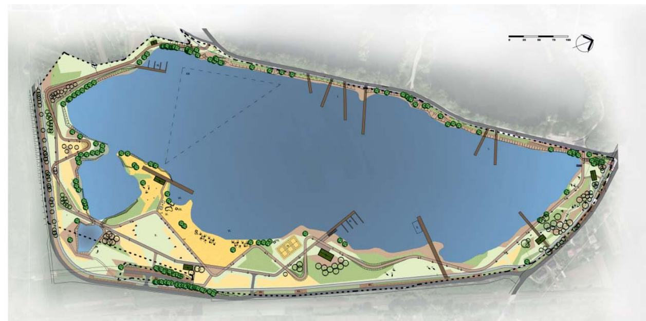
Il. 4. Projekt zagospodarowania terenu wokół zbiornika wodnego w Przylasku Rusieckim, proj. MTWW Architekci / Site plan of the area around the water reservoir in Przylasek Rusiecki, design by MTWW Architekci

The goal of the design was the creation of a place that would be beautiful and that would teem with life, which will be the goal of walks and bicycle trips, providing rest for the residents and an attractive recreational area, while making use of the existing wealth of natural resources, which include the existing greenery, the water reservoir and the interesting shape of the terrain. The space is aimed at families with children, as well as senior citizens, school groups and organized tours, but also at individual persons. The design was also to take into account a safe, mixed-use centre of rest and active, as well as passive recreation. The revitalisation includes an ordering of the terrain, a redevelopment of the layout of pedestrian paths, parking lots, pedestrian-only and pedestrian and bicycle corridors, the construction of new recreational structures and