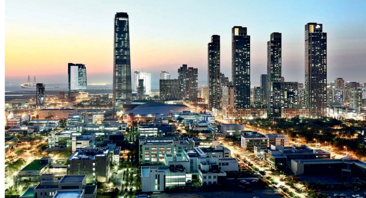
Il. 1. Songdo w Korei Południowej / Songdo, South Korea

Masdar niedaleko Abu Dhabi w Emiratach Arabskich przeznaczony dla 40.000 osób zamieszkały jest na razie jedynie przez 300 osób, głównie studentów miejscowego uniwersytetu 3 . Zaprojektowane zostało przez Foster + Partners jako miasto o minimalnej emisji dwutlenku węgla, wykorzystujące energię odnawialną. W mieście będzie zakaz poruszania się samochodami nielektrycznymi, a budynki zostaną wyposażone w nowoczesne technologie smart, by chronić się przed pustynnym upałem i obniżyć koszty ich chłodzenia. Mimo, że Emiraty Arabskie to jeden z największych dostawców ropy naftowej, miasto będzie otrzymywać energię wyłącznie z kolektorów słonecznych. W efekcie, miasto będzie zużywać jedynie 20% energii, którą zużywają miasta podobnej wielkości 4 .