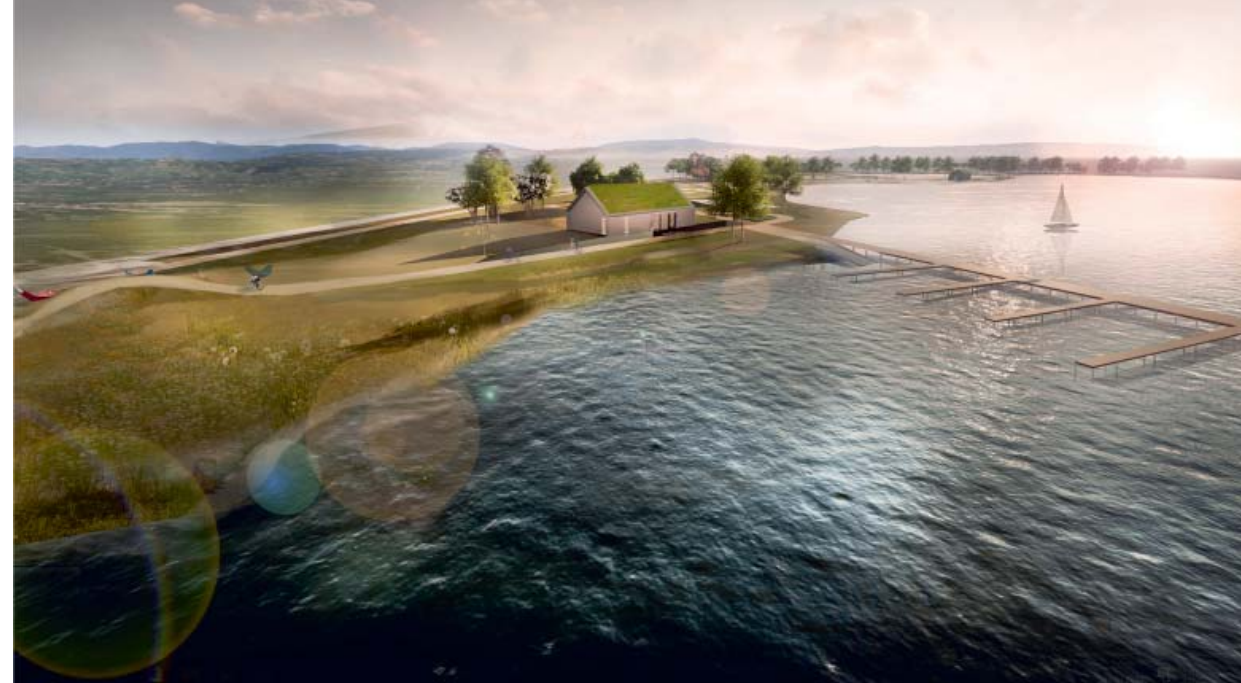
Il. 3. Otoczenie zbiornika w Przylasku Rusieckim w Krakowie, proj. MTWW Architekci / The area surrounding the water reservoir in Przylasek Rusiecki, design by MTWW Architekci

One attempt of adapting an area to the modern world is a conceptual design of the development