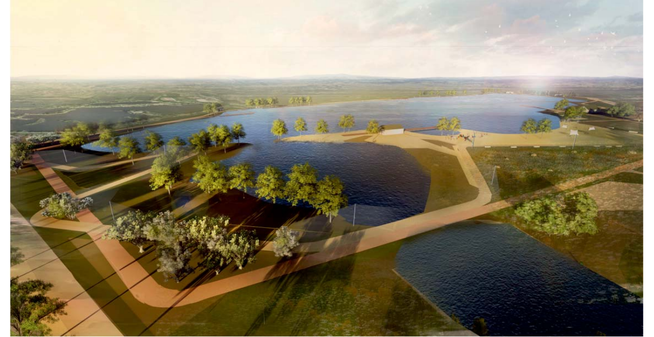
Il. 7. Widok na zbiornik, z przodu promenada rekreacyjna i bulwar C, proj. MTWW Architekci / A view of the reservoir, with the recreational promenade and boulevard C in the foreground, design by MTWW Architekci

zaliczane do roślinności rodzimej. Atrakcją projektowanego terenu pod kątem zieleni będą łąki kwiatne. Sprawdzają się one w trudnych warunkach siedliskowych stanowiąc ostoję dla zwierząt. Gatunki zostały dobrane tak, by łąka kwitła od wiosny do jesieni. Rozwiązania przyrodnicze zostały przyjęte ze szczególnym uwzględnieniem aspektu proekologicznego. Wprowadzone nasadzenia różnicuje się wysokościowo i gatunkowo, lecz wszystkie stanowią kontynuację gatunkową otaczających roślin.