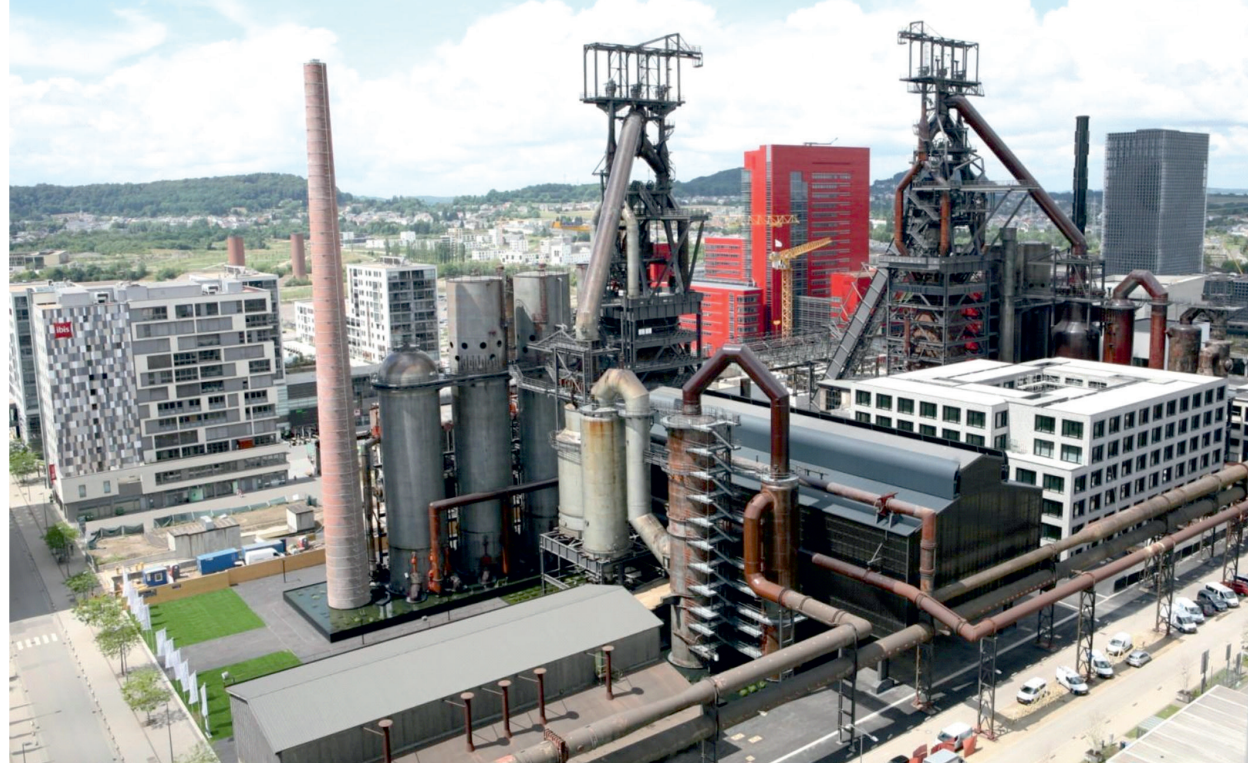
Il. 2. Widok na część Nowego Belval z zachowanymi relikwiami dawnej huty, między które wkomponowano nową strukturę urbanistyczną. W tle widoczny czerwony biurowiec Dexia BL, źródło: http://www.redrock.lu/ , dostęp: [31 VIII 2017]/View of a part of New Belval with preserved relics of the former steelworks, between which a new urban structure has been embedded. In the background – a red office building of Dexia BL, source: http://www.redrock.lu/ , access on 31 Aug. 2017

dzinną i rekreacyjną. Główną osnową założenia jest postindustrialny charakter uzupełniony nowoczesną zabudową. Tym, co wyróżnia proces rewitalizacji dawnej huty Belval, jest jej kompleksowość – zarówno pod względem administracyjnym, komercyjnym jak i społecznym – oraz podejście do zastanej struktury pohutniczej.