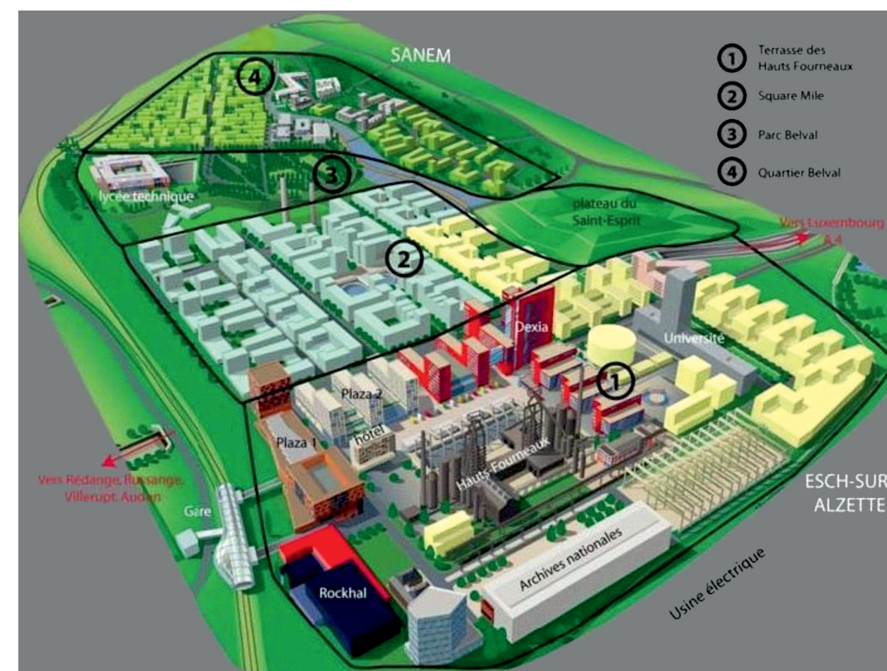
Il. 3. Plan Nowego Belval: 1- dzielnica Tarasy Wielkich Pieców, rdzeń kulturalny miasta, 2- multifunkcyjna dzielnica Square Mile, 3- Park, 4- Quartier Belval – obszar zabudowy mieszkalnej, źródło: http://www.belval.lu/en/

The resultant brownfield site became a field of co-operation between the ARBED group and the authorities of Luxembourg. In 2000 Agora company was established. Its goal is to plan and implement an urban organism on the post-steelworks terri-