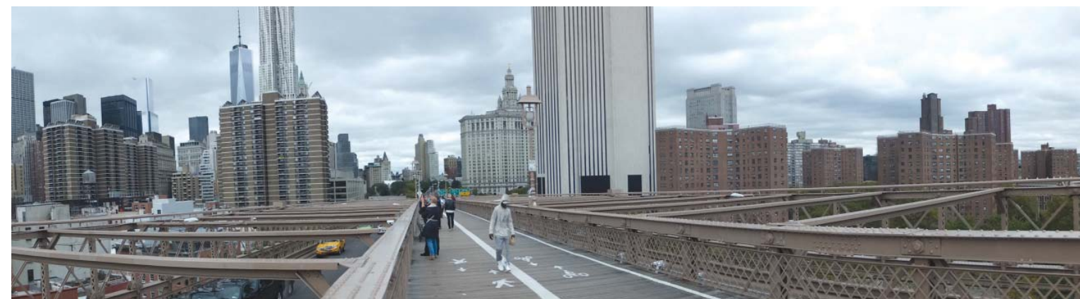
il. 4. Ścieżka rowerowa na Brooklyn Bridge. / Cyclin lane on Brooklyn Bridge.