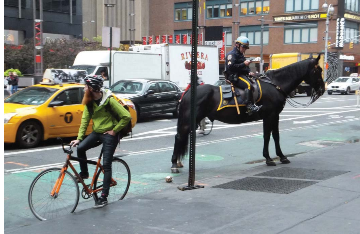
il. 1. Przyjazni środowisku. Fot. Jarosław Huebner 2014 / Environmentally friendly. Photo Jaroslaw Huebner 2014

The nearest future of traffic monitoring systems is most of all commonly available smart phones, which after installing a relevant application can become universal tools facilitating moving around the city. Combination of these hardware opportunities with the social media is the most efficient and precise traffic control method. The example is the application called Waze Social GPS Maps & Traffic 6 , extremely popular in the USA. It is an automotive navigation system, in which a very important role is played by the community of its users. They make sure that its information base is up-to-date. The software is extremely popular thanks to up-to-date information on traffic controls and congestions. The interface allows to add reports and to navigate. What is significant, such an application