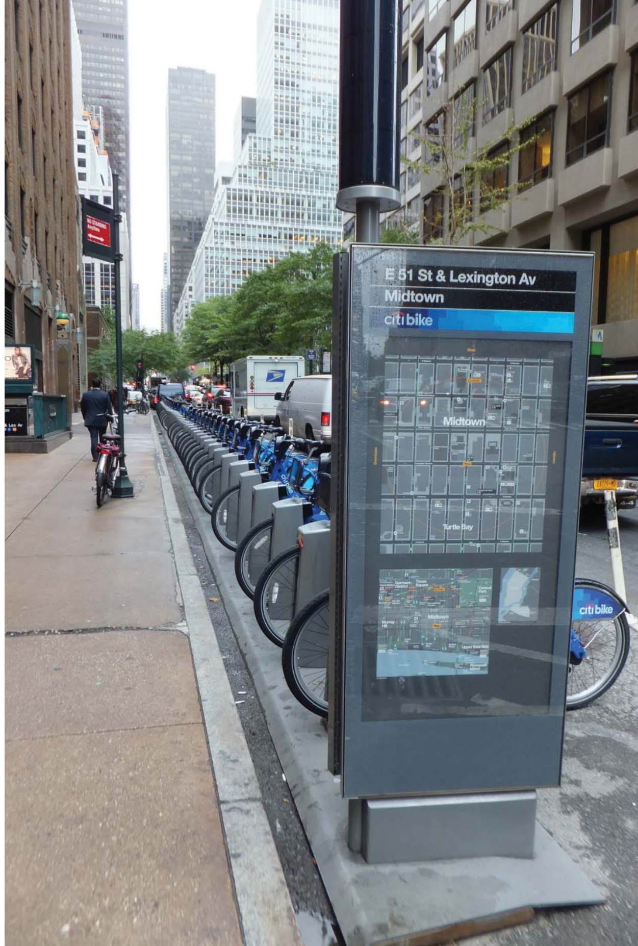
il. 2. Stacje rowerowe. Fot. Jarosław Huebner 2014 / Bike stations. Photo Jarosław Huebner 2014