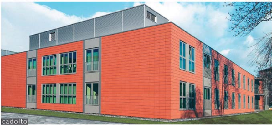
il. 5. Oddział szpitalny Uniwersyteckiej Kliniki Ginekologicznej w Düsseldorf / Hospital ward in University Gynecology Clinics, Düsseldorf

Również w eksploatacji budynki modułowe są konkurencyjne dla technologii tradycyjnej. Wszystko zależy od założonego standardu energetycznego i wymogów cenowych inwestora. Właściwości termoizolacyjne przegrody spełniają obowiązujące normy.