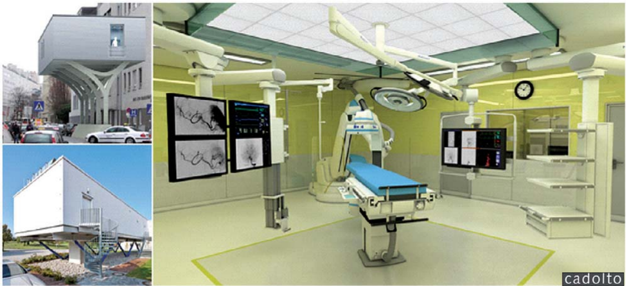
il. 4. Kompletny hybrydowy moduł operacyjny – pierwsza sala operacyjna przyszłości w systemie modułowym / Complete hybrid operating module – the first operating theatre of the future in the module system

diagnostyczne, laboratoria i punkty apteczne, hotele przyszpitalne, przychodnie, pomieszczenia administracji, magazyny i pomieszczenia techniczne. Wnętrza modułów są wykańczane na etapie produkcji. Są wyposażane w odpowiednie materiały wykończeniowe podłóg, ścian i sufitów. Moduł – kontener dostarczany na budowę posiada również ceramikę sanitarną, lampy oświetleniowe, stolarkę okienną i drzwiową, a także inne akcesoria. Elewacje w zależności od rodzaju są wykonywane częściowo lub całościowo na etapie produkcyjnym. Standard materiałów użytych do wykończenia wnętrza oraz estetyka materiałów uzależniona jest od możliwości i potrzeb inwestora. Dzięki takiemu systemowi koncentracji pracy transport jest ekonomiczny i ekologiczny.