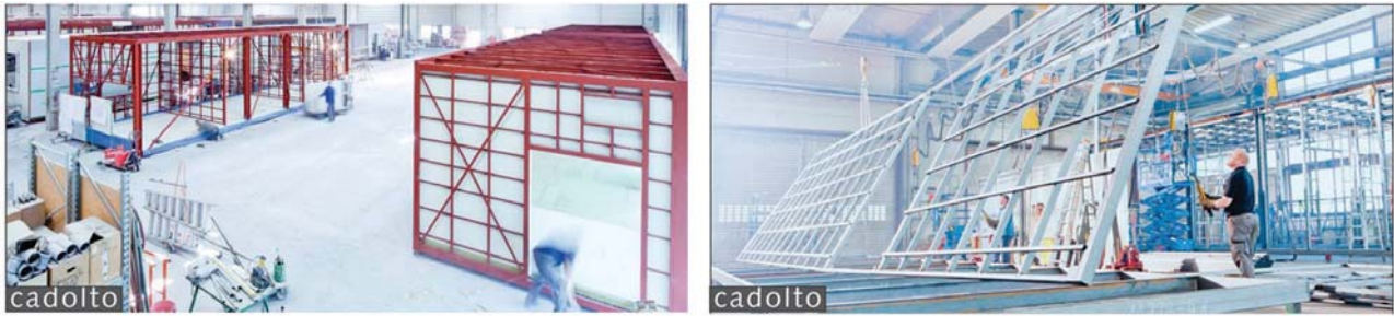
il. 1. Praca nad modułami budowlanymi w warunkach fabrycznych / Works on construction modules in a factory

cie. Jego parametry użytkowania są zbliżone do pożądanych lub wymagają niewielkiej obróbki. Metoda prefabrykacji pozwala na przygotowanie 90% elementów składowych budynku w fabryce. Taki sposób daje możliwości pracy pod ścisłym nadzorem i pełną kontrolą jakości. Stanowi to cenną wartość dla obiektów budowlanych. Procedury produkcyjne oparte są na sprawdzonych i ustandaryzowanych procesach, tworząc w nowoczesnych fabrykach podstawy jakości i trwałości.