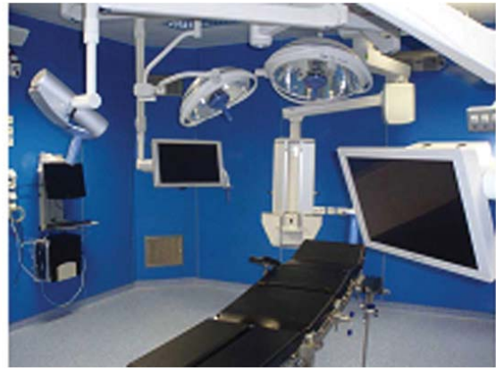
il. 7. Pomieszczenia bloku operacyjnego w Regionalnym Szpitalu w Kołobrzegu / Operating unit in Regional Hospital, Kołobrzeg

system pracy przy takiej inwestycji zajął by około dwa lata, tymczasem ustawienie na stalowej konstrukcji przygotowanych wcześniej modułów zajęło jedynie 4 dni. Inwestycja polegała na nadbudowie kondygnacji, z funkcją intensywnej terapii dla dzieci oraz blokiem operacyjnym, wraz z windą zewnętrzną. Projekt był podzielony na trzydzieści jeden elementów – modułów posadowionych na czwartej kondygnacji istniejącego obiektu. Moduły opierały się na nowo wykonanej konstrukcji stalowej.” 5