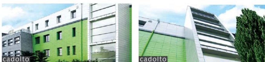
il. 6. Regionalne Centrum Krwiodawstwa i Krwiolecznictwa we Wrocławiu / Regional Centre of Blood Donation and Hemotherapy in Wrocław

Kolejnym przykładem jest „Dzienne Ursynowskie Centrum Zabiegowe (DUCZ), specjalizujące się w wykonywaniu procedur jednego dnia w zakresie chirurgii, ortopedii, urologii, ginekologii, okulistyki, endoskopii, z możliwością zwiększenia panelu świadczeń. Wykonywanie zabiegów w tzw. trybie jednodniowym jest tańsze dla płatnika i wygodniejsze dla pacjentów. Jest też bezpieczniejsze pod względem ryzyka powikłań infekcyjnych. Jest to 3-kondygnacyjny obiekt zawierający: oddział łóżkowy z 14 stanowiskami, dwie sale operacyjne wraz z zapleczem, służy dla pacjenta i lekarzy, salę pooperacyjną (tzw. wybudzeniową), pracownię endoskopii, pomieszczenie sterylizacji oraz gabinetu diagnostyczno – zabiegowe. Obiekt składa się z 31 modułów, wykonanych w zakładach produkcyjnych Cadolto w Krölpä w Niemczech. Moduły wykonane są w 90% z prefabrykatów, co oznacza, iż każdy moduł zawiera w sobie wszelkie przewidziane w projekcie instalacje, elementy wykończeniowe. Pokoje są niemal całkowicie gotowe, pomalowane, posiadające oświetlenie, ceramikę sanitarną, meble, stolarkę drzwiową oraz okienną.” 3