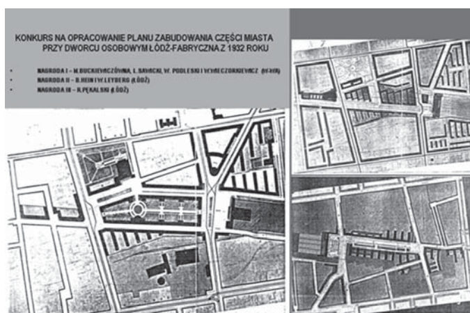
il. 4. Projekty semestralne i prace dyplomowe studentów kierunku Architektura i Urbanistyka PŁ / Diplomas and term project by The Architecture and Urban development Łódź Technical University students