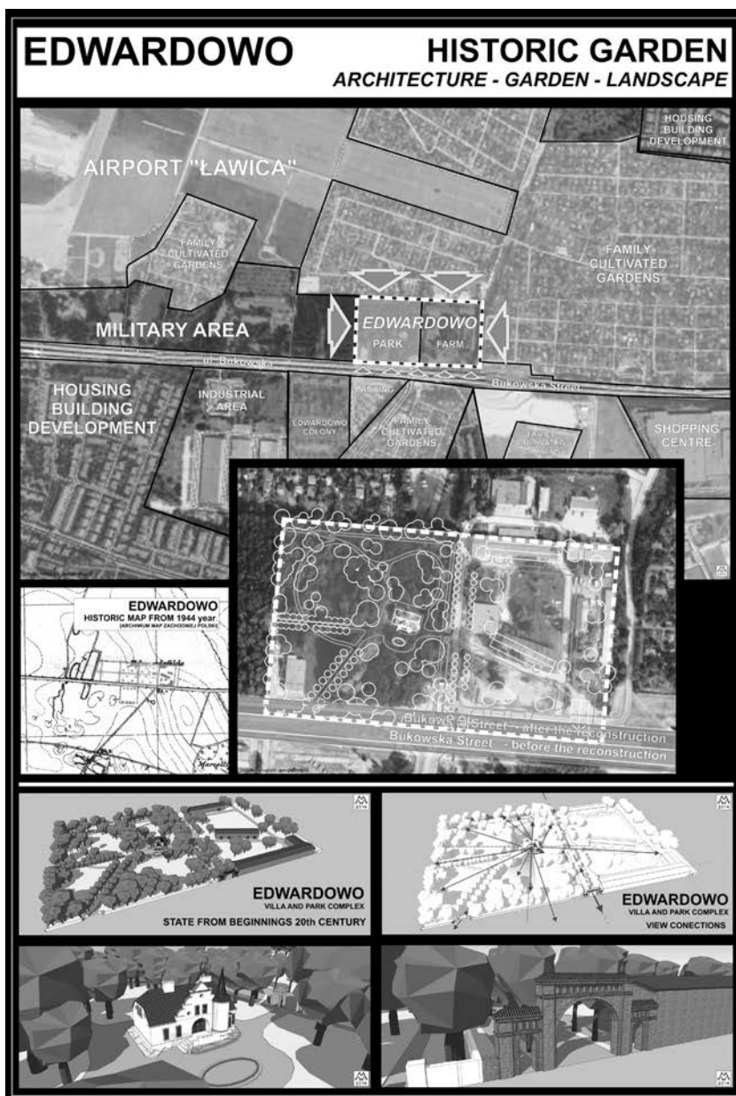
III. 2. The analysis of land use in close proximity to the estate. 3D model of the Edwardowo estate – general view of the estate and close-ups to mansion and historical gate (edited by M. Walerzak 2014)