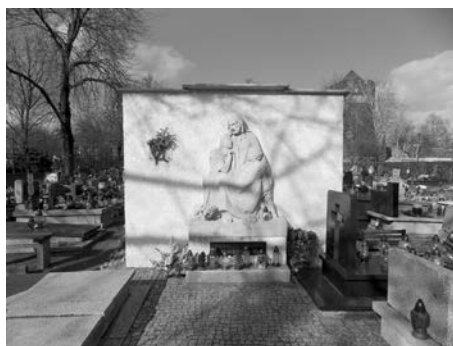
III. 2. Memorial commemorating the events from the fire of 1919

Historic sculptures and grave monuments, apart from aesthetical values, also constitute the memory of events that have taken place in the history of a region. An example of this kind of object can be found in the Lime Cemetery in Gliwice. The necropolis was founded in 1884, on the terrain situated in the north-east from the city center. In the beginning it occupied a space of about 6 hectares. Over time, the cemetery has been enlarged several times, at the expense of adjacent forest. In the western part of the cemetery, near to the funeral home, once was located the memorial which commemorated the tragic events that took place in March 1919. When, due to a fire in the Capitol Cinema in Gliwice, 76 children died, because they were not able to escape from a locked movie theater. Most of them were buried in a common grave by Paul Ondrush, presenting Christ grasping two children in his arms 10 . Over time, the condition of the monument and its nearest surroundings gradually deteriorated. At present, the monument is renovated and the sculpture presenting Christ with the two children are mounted on a white wall. At the bottom is the inscription: "May children come to me". On the left side is a plaque with a description of the disaster.