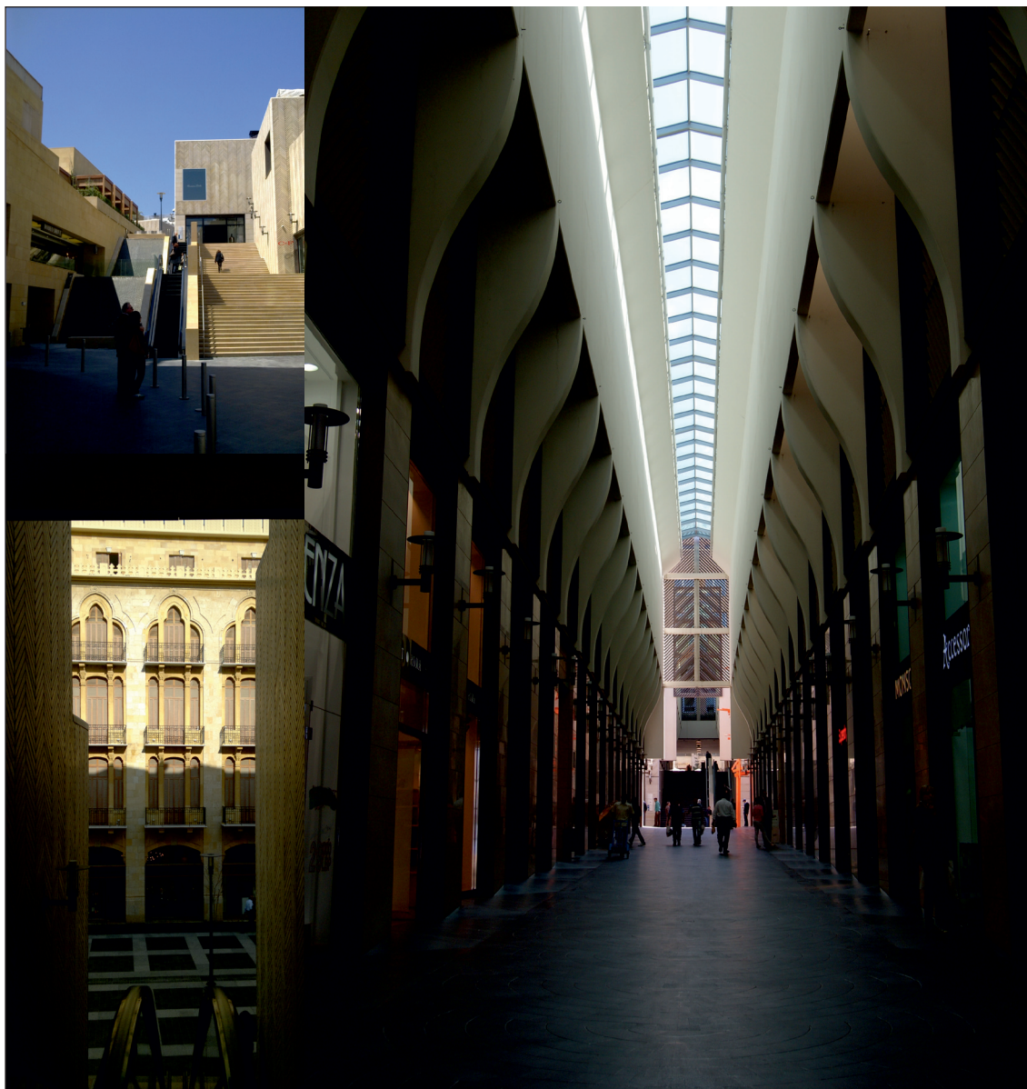
III. 2. Souks in Beirut. Central District. Architect Rafael Mone

II. 2. Targowisko w Bejrucie. Bejtur Dzielnica Centralna. Architekt Rafael Moneo