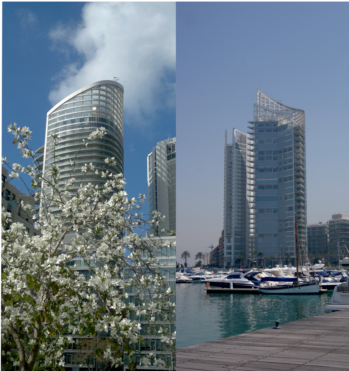
III. 3. Skyscrapers at Zaitunay Bay. Beirut Central District. Skyscrapers design Khon Pedersen Fox, Zaitunay Bay design Steven Hall