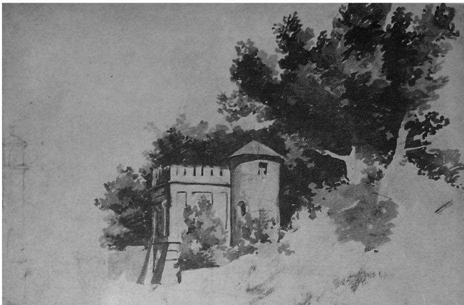
III. 1. F. Kostrzewki, Mauretanski House in Mokotów