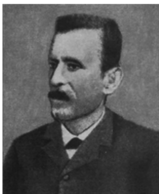
Fig. 1. Władysław Wojciech Zajączkowski (1837–1898)

journals. Several previously published papers were repeated in an expanded version in other languages. Moreover, he published several works on history, popular science, or teaching.