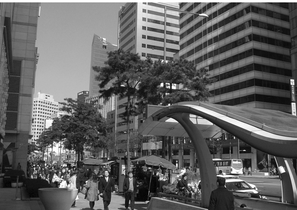
Il. 1. Główny ciąg pieszy w śródmieściu Seulu z małą architekturą. (Fot. M. Mularz) / The main pedestrian route in downtown of Seoul with street furniture. (Fot. M. Mularz)

The capital of South Korea was the meeting point of important trade routes, and therefore Seoul was the subject of dispute between the rulers. In the eleventh century, Goryeo Dynasty in Seoul built the palace complex of buildings called the Southern Capital. In addition,