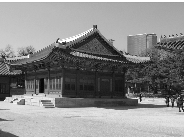
Il. 3. Park miejski w Seulu. (fot. M. Mularz) / City Park in Seoul. (fot. M. Mularz)