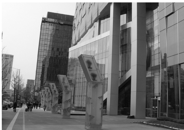
Il. 6. SK-Telecom Headquarter Building z perspektywy pieszego. (Fot. M. Mularz) / SK Telecom Headquarter Building from the perspective of a pedestrian. (Fot. M. Mularz)