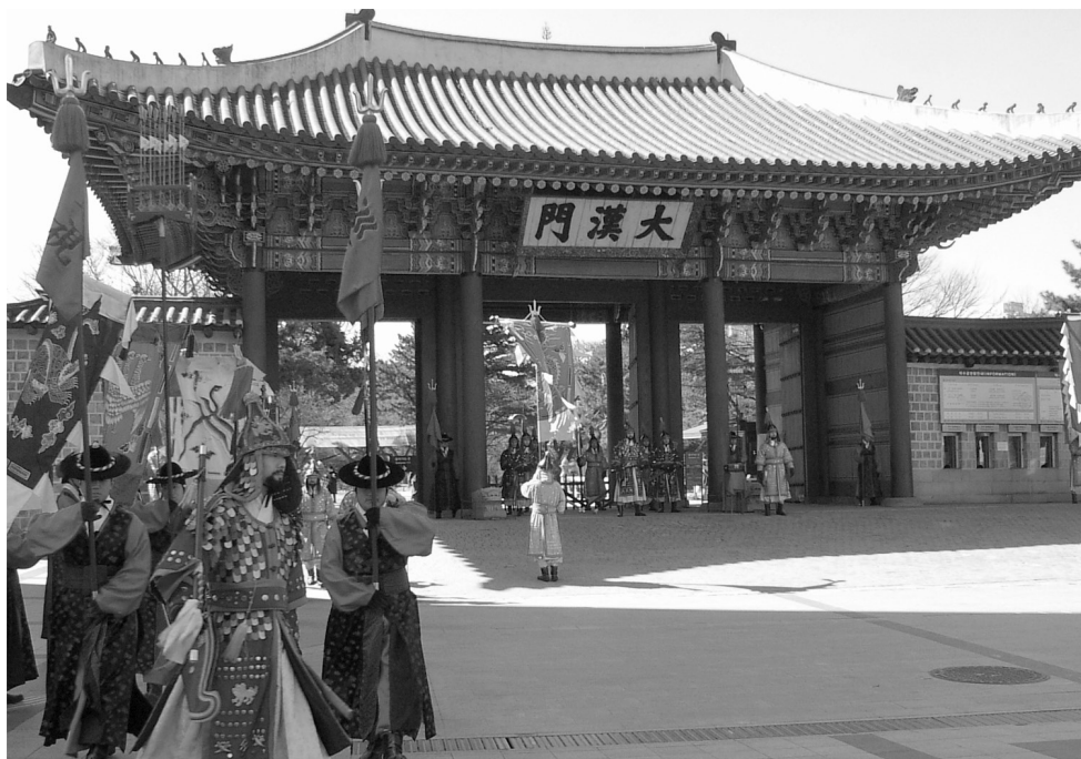
Il. 2. Inscenizacja zmiany warty na tle zachowanej bramy miejskiej z okresu Trzech Królestw w pieszej przestrzeni publicznej śródmieścia Seulu. (Fot. M. Mularz) / Staging of changing of the guard in the background of preserved city gate from the Three Kingdoms period in pedestrian public space in downtown of Seoul. (Fot. M. Mularz)

The preserved gates of defensive stronghold Wiryeseong (il. 2). is an example of the first case. They are located along the main roads, which were an important trade routes in the past. These gates have been renovated and are a part of the urban fabric, hence their existence