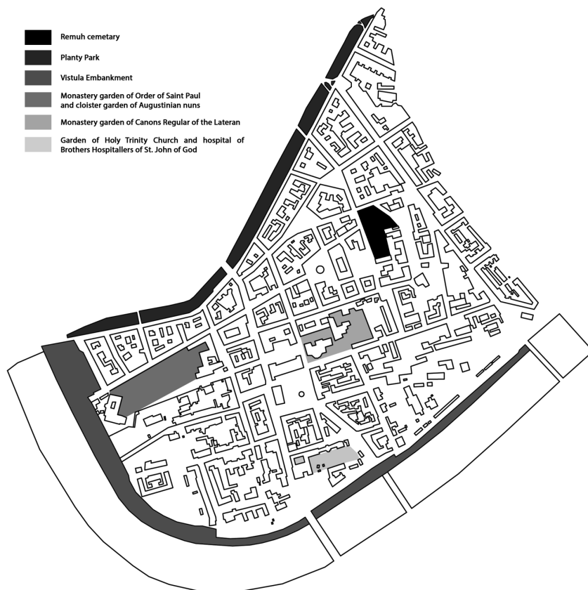
Ill. 1. Location of green areas in the old Kazimierz district (edited by J. Klimek)