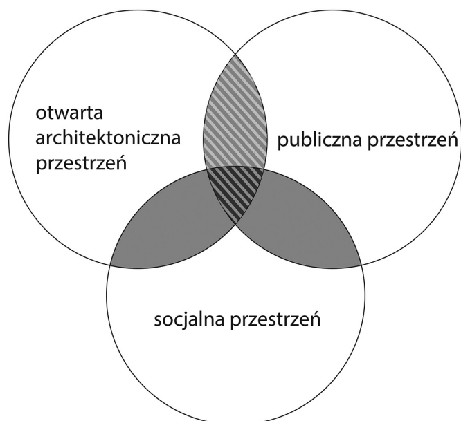
il. 1. Zestawienie otwartej architektonicznej, publicznej i socjalnej przestrzeni, a także obszar przestrzeni, jaki staje się przedmiotem badania (il. aut.) / Open architectural space, public space and social space. The selected area presents the focus of this research (il. aut.)

Adaptation of the space of post-socialist housing estates. After the collapse of the Soviet Union the public space of microrayons became the 'litmus paper' of social changes. In terms of transition to the trade economy, inconsistent with the logic of Soviet 'dormitory' estates, the interconnection public-private changed one more time. Rapid privatization of public space, its control by business and authorities and non-participation of city dwellers in decision making were typical for the post-soviet period [18]. Besides, the crime rate increased dramatically in the 1990's, which also affected the physical space of the es-