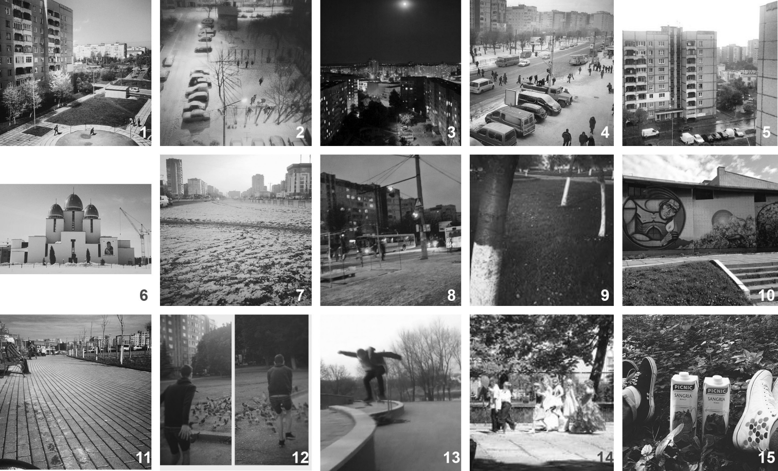
il. 4. Przykład zdjęć kategorii „B” – zdjęcia przestrzeni otwartej zrobione z wnętrza (1-5), „C” – zdjęcia zrobione w przestrzeni otwartej: obserwacja (6-10), interakcja (11-15). Zdjęcia użytkowników Instagramu o nickach darynka_kukhar (1), severko (2), theromanlviv (3), vitalikinakh (4), drt46 (5), severko (6), vitalikinakh (7), vitalikinakh (8), tkarabin (9), halynamalyna (10), oswaldjane (11), crispycr1sp (12), heletiy (13), sianusia (14), solomiya_hulyanych (15) / Examples of photos of category 'B' – photos of open space, made from interiors (1-5), 'C' – photos made in open space: observation (6-10), interaction (11-15). Photos published with by Instagram users with usernames darynka_kukhar (1), severko (2), theromanlviv (3), vitalikinakh (4), drt46 (5), severko (6), vitalikinakh (7), vitalikinakh (8), tkarabin (9), halynamalyna (10), oswaldjane (11), crispycr1sp (12), heletiy (13), sianusia (14), solomiya_hulyanych (15)

Na wielu fotografiach nie widać ludzi, widoczne są jedynie perspektywy ulic, zespoły architektoniczne itp. Analizując aktywność ludzi w przestrzeni, można powiedzieć, że niemal wszystkie są „niezbędne” według klasyfikacji Gehla i zaspokajają tylko podstawowe potrzeby (droga do pracy, zakładów usługowych, przystanki komunikacji). Przestrzeni, przedstawione na zdjęciach, sprzyjające temu, by ludzie mogli w nich zatrzymać się na dłużej – to niewielkie parkowe tereny obok cerkwi i kinoteatru w głównym publicznym centrum.