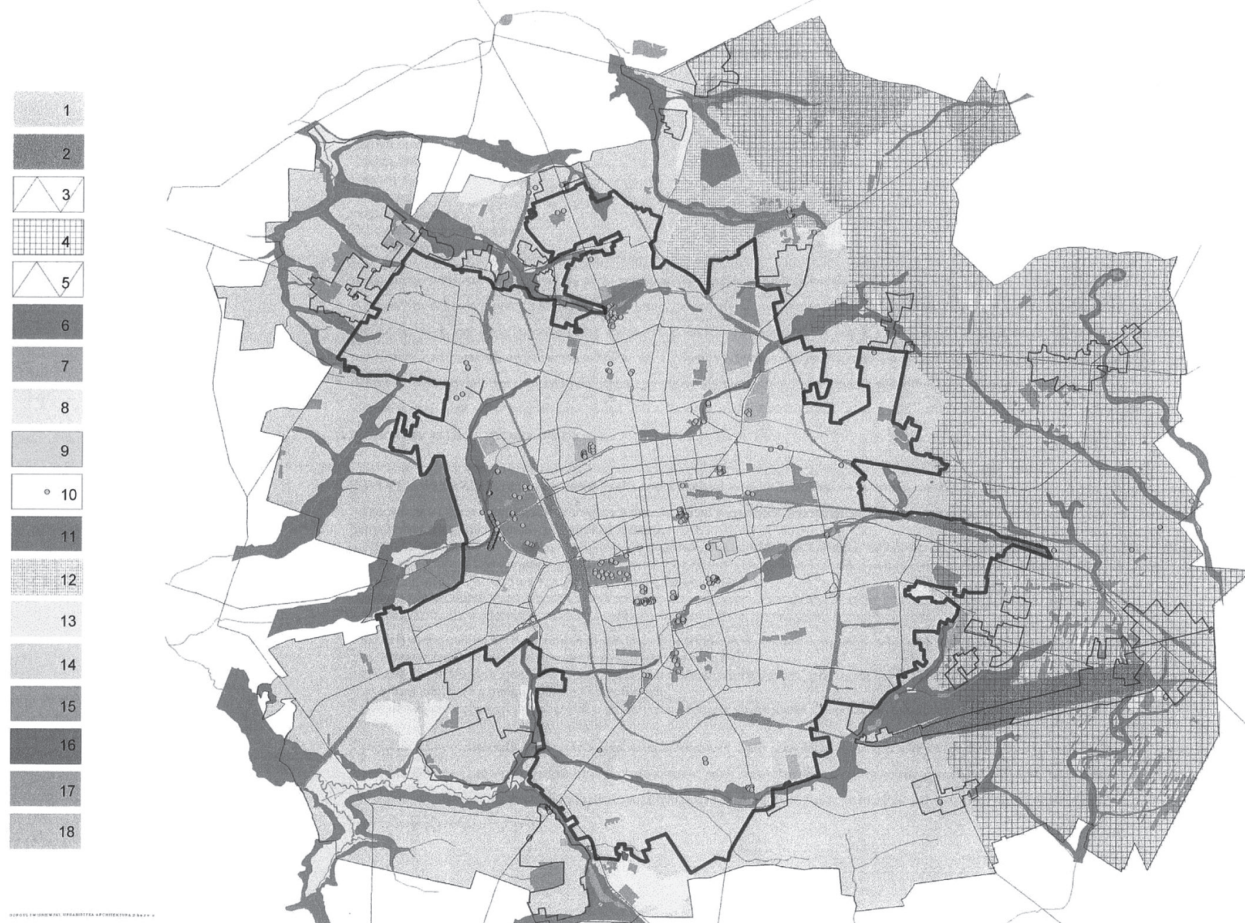
il.1 Mapa Studium Uwarunkowań i Kierunków Zagospodarowania Przestrzennego Łodzi. Tereny o przewadze wartości przyrodniczych podlegających ochronie. Widoczne zespoły, tereny zielone tworzące czytelny układ oplatający miasto. Układ zieleni sprzyja wyjątkowej koegzystencji zespołów zabudowy z otwartymi terenami stanowiącymi atrakcyjne przestrzenie dla ruchu pieszego, dla możliwości łączenia ciągami pieszymi zespołów osiedli mieszkaniowych. Wartości wyjątkowe tkwią w możliwości powiązań bezpośrednich, dostępnych dla pieszych, terenów podmiejskich posiadających wielki potencjał funkcji rekreacyjnych. Studium Uwarunkowań i Kierunków Zagospodarowania Przestrzennego Miasta Łodzi (wyd. Urząd Miasta Łodzi 2011) / Study map of conditions and directions of spatial development in Łódź. Areas of predominant natural values are protected. The green areas surround the city. The natural setting provides an unique spatial coexistence of urban and open space – attractive for pedestrian traffic and possible to connect housing estates with pedestrian routes. Suburban areas have great potential for recreational functions

stanu przedmieść Łodzi stanowi zaprezentowany wykaz terenów (rys. 2), z istniejącymi i potencjalnymi wartościami kulturowymi tych miejsc oraz opis stanu istniejącego i możliwych następstw działań gentryfikujących o charakterze komercyjnym (rys. 3–10).