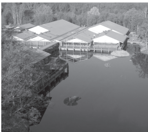
il. 6 Obszar 3. Przykład realizacji łagodnej gentryfikacji. Ośrodek sportowo – rekreacyjny. Obiekt o wielkiej wartości dla obszaru, polegającej na łączeniu funkcji sportowo - rekreacyjno - kulturalowej. Jest miejscem spotkań, swego rodzaju przystankiem dla spacerowiczów, pomiędzy terenami zielonymi zachodniego i północnego obszaru miasta. Teren leżący pomiędzy Łodzią i Zgierzem jest pozytywnym przykładem przemyślanej gentryfikacji obszaru. Od zachodu obszar łączy się z Lasem Zgierskim a od północnego wschodu stanowi rozległy obszar obejmujący również Las Łągiewnicki. Materiały informacyjne www.salebiznesowe.pl / Area 3 . An example of non-intrusive gentrification. A building of great value for the area – combines sport, recreation and culture. It is a meeting point for strollers, between the western and northern green areas of the city (between Łódź and Zgierz) from the West it connects to the Zgierski Forest; from the North – East the Łągiewnicki Forest

Zadajmy sobie pytanie, co otrzymuje przy takich procesach obywatel żyjący na tak gentryfikowanym obszarze? Pierwszym zjawiskiem jest wzrost wartości terenu, a co za tym idzie podniesienie kosztów utrzymania nieruchomości i budynków. Proces ten nieuchronnie powoduje „emigrację” uboższych grup społecznych, zamianę na grupę zdecydowanie zamożniejszą lecz niezbyt z terenem i napływającą tam zwykle w związku z panującą „modą” na dany obszar. Powoduje to stopniowe rugowanie z obszaru wielu grup społecznych, ponieważ proponowane zagospodarowanie, choć uszlachetniająca funkcjonalnie, nie daje szans korzystania z tych wysoko budżetowych usług szerokiej rzeszy „starych” mieszkańców.