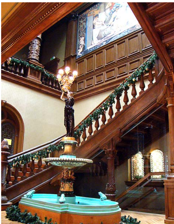
Ryc. 3. Wnętrze wraz z główną klatką schodową, pośrodku fontanna, powyżej malowidło ścienne. 2011 r. Fig. 3. Interior with the main stairwell, fountain in the middle, a wall painting above; 2011.