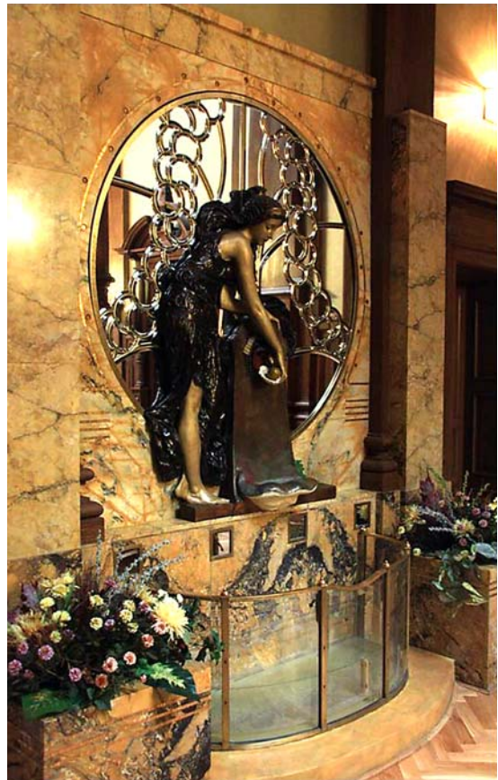
Ryc. 8. Fontanna na I piętrze holu głównego po pracach konserwatorskich, 2012 r.