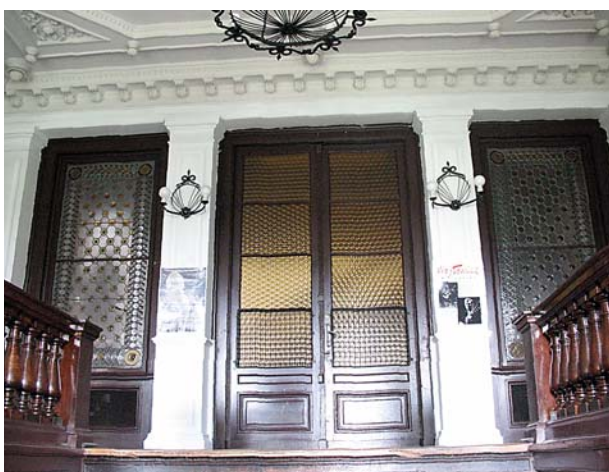
Ryc. 5. Hol wejściowy przed rozpoczęciem prac, 2007 r. Fig. 5. Entrance hall before commencing work, 2007.