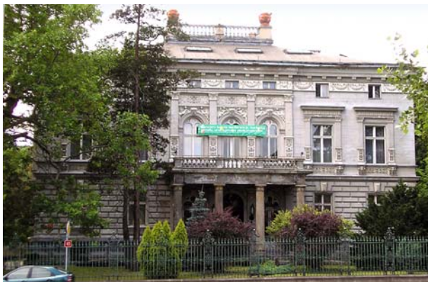
Ryc. 1. Elewacja frontowa przed rozpoczęciem prac, 2007 r. Fig. 1. Front elevation before commencing work, 2007.