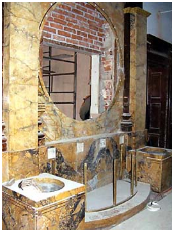
◀ Ryc. 7. Fontanna na I piętrze holu głównego w trakcie prac, 2010 r.