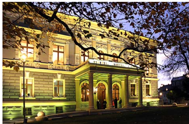
Ryc. 2. Willa po pracach konserwatorco-restauratorskich, 2011 r. Fig. 2. Villa after conservation-restoration work, 2011.