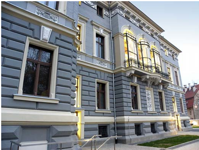
Fig. 9. Back elevation with the loggia after conservation work, 2011. Fig. K. Piecuch