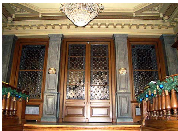
Ryc. 6. Hol wejściowy: stolarka mazerowana, filary z imitacją granitu, witraże, strop sztukatorski po pracach konserwatorskich, 2011 r. Fig. 6. Entrance hall: marbleized joinery, pillars with granite imitation, stained glass, stucco ceiling after conservation work, 2011.