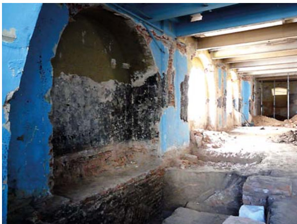
Ryc. 1. Lublin, klasztor powizytkowski. Nawa kościoła w trakcie prac wykopaliskowych i budowlanych. Płytkie wnęki-kaplice boczne wschodniej ściany nawy, widok na SE. Fot. C. Hadamik, lipiec 2010 r. Fig. 1. Lublin, post-Visitationist monastery. Nave of the church during excavation and building work. Shallow niches-side chapels on the east wall of the nave, view to SE. Photo by C. Hadamik, July 2010