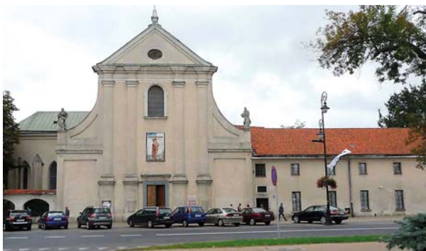
Ryc. 3. Lublin, kościół Kapucynów. Fasada główna, widok na S. Fot. C. Hadamik, sierpień 2010 r. Fig. 3. Lublin, Capuchin church. Main facade, view to S. Photo by C. Hadamik, August 2010