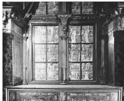
Fig. 5. Window with decorative lights held by lead muntins, the north wall of the Great Council Room. Fragment of a painting by Heinrich Hansen from around the mid-19 th c.