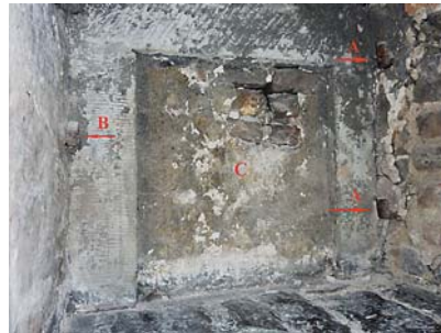
Ryc. 3. Wnętrze wnęki: a) haki po zawiasach drzwiczek, b) otwór do zasuw, c) zamurowanie z ok. 1594 r.