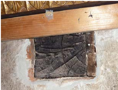
Ryc. 2. Gniazdo z fragmentem spalonej belki pochodzącej z pierwotnego stropu