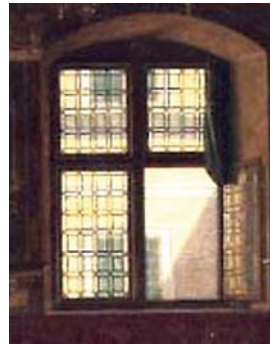
Ryc. 5. Okno z dekoracyjnym oszkleniem szybkami oprawionymi w ołowiane szprosy, północna ściana Wielkiej Sali Rady. Fragment obrazu Heinricha Hansena z ok. poł. XIX w.