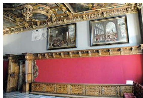
Ryc. 10. Widok na ścianę wschodnią po wykonaniu obicia suknem według historycznego podziału kolorystycznego. W górnej części pozostawiono „okienka” umożliwiające oglądanie gotyckich malowideł