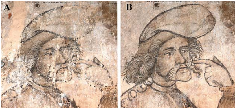
Ryc. 1. Fragment gotyckiego malowidła na ścianie wschodniej Wielkiej Sali Rady z przedstawieniem głowy postaci symbolizującej Pychę : a) po pracach konserwatorskich, b) po wykonaniu komputerowego retuszu konserwatorskiego