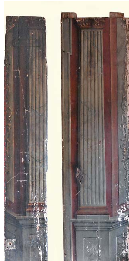
Ryc. 8. Zidentyfikowane w składnicy Wojewódzkiego Konserwatora Zabytków w Gdańsku elementy z obudowy drzwi w przejściu z Sali Czerwonej do Zimowej. Stan przed konserwacją (2008 r.)