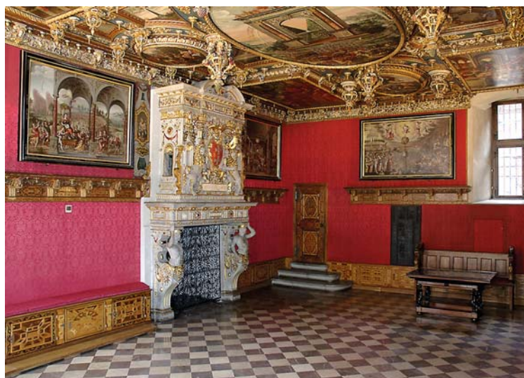
Ryc. 9. Wielka Sala Rady, widok na pn.-zach., stan z 2007 r. Fig. 9. The Great Council Room, view onto the north – west, state from 2007.

Window frames with lavish late-Renaissance woodcarving and intarsia decoration in the Great Council Room can be seen in the photograph taken by W. Drosta around 1943. (fig. 6). A detailed analysis of this window, its ornamentation and construction allowed for establishing whether it was made at the end of the 16 th c. Wooden joinery was made in the form of a box construction, and glazed with large window panes the size of the whole section in the outer sashes and with lights in wooden cross muntins in the inner sashes. The sashes were hung using tenon