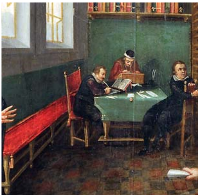
Ryc. 4. Fragment obrazu Tajna Kancelaria autorstwa malarza z kręgu Antona Möllera, pocz. XVII w., obecnie w zbiorach Muzeum Narodowego w Gdańsku (MNG), dawniej znajdował się w Ratuszu Głównego Miasta Gdańska