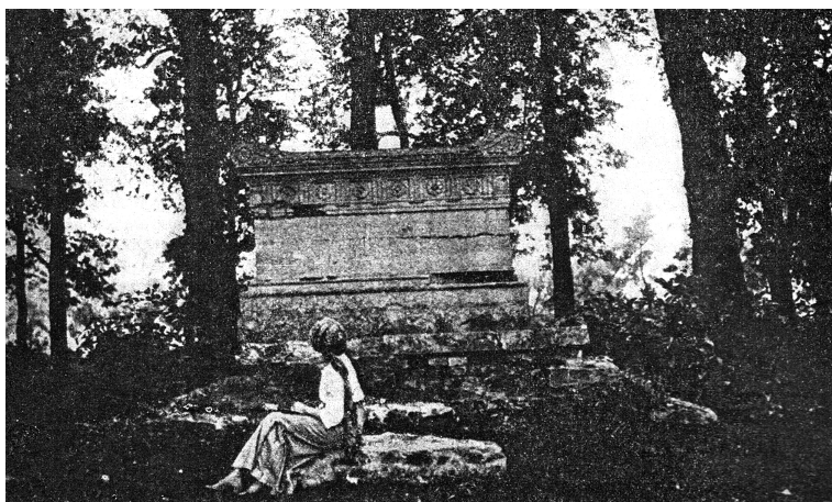
Il. 1. Sarkofag w Gucinie – widok od strony stawu (fot. J. Szamurin, 1915)

Teren poddany badaniom to obszar dawnego założenia ogrodowego Gucin-Gaj oraz towarzyszący mu i historycznie z nim związany zespół kościoła pw. św. Katarzyny. Zlokalizowane są na terenie Warszawy, w północno-wschodniej części dzielnicy Ursynów. Obejmują fragment wzgórza skarpy warszawskiej oraz obszar poniżej, na który składają się: niecka podskarpowa, źródlika i miejsca bagniste. Ukształtowanie wzgórza oraz tarasu podskarpowego stanowią elementy charakterystyczne położenia Gucina i kształtują jego specyficzny układ przestrzenny. W ujęciu szczegółowym teren założenia Gucin-Gaj obejmuje obszar o łącznej powierzchni 7,5 ha, w którego skład wchodzi: teren dawnego ogrodu górnego (z miejscem po dawnym dworcu