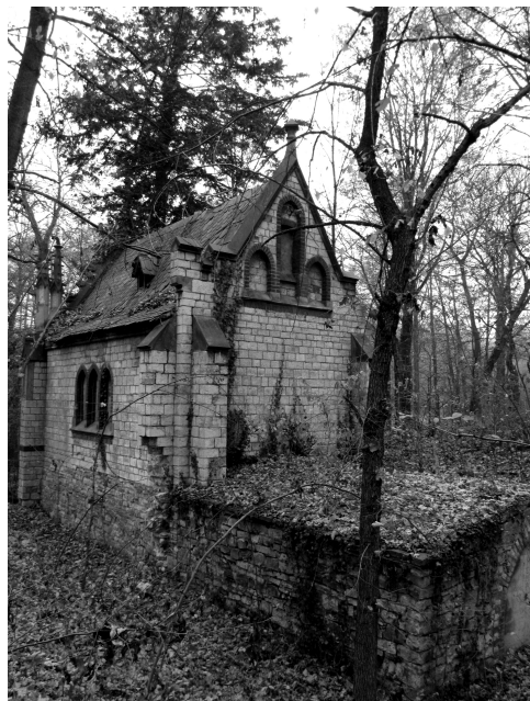
Il. 1. Mauzoleum w Dobrej