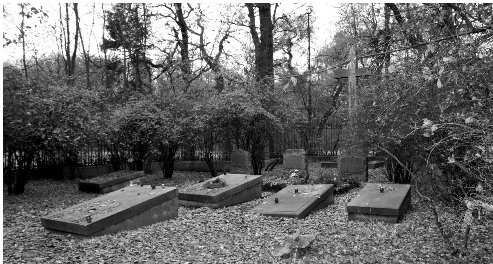
II. 3. Cmentarz przy rezydencji w Mosznej