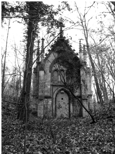
Ill. 1. Mausoleum in Dobra