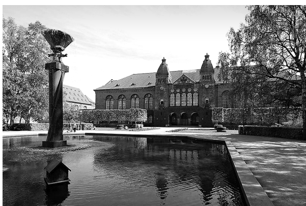
Ryc. 29. Duńska Królewska Biblioteka. Kopenhaga. H.J. Holm, 1906 Fig.29. Danish Royal Library. Copenhagen. H.J. Holm, 1906

zaprezentowała drewniane budynki, tym razem spełniające nowoczesne funkcje, przystosowane również do projektowania reprezentacyjnych willi (dworów), w których widoczne były owe wysunięte nadwieszania w górnych partiach obiektów. Architektura ta promowana była jako szwedzko-norweski styl narodowy.