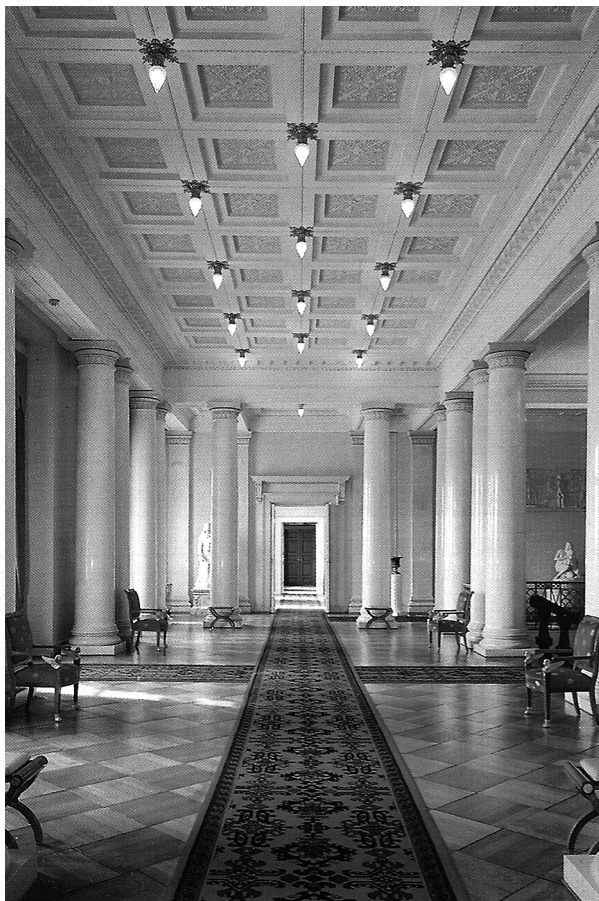
Ryc. 5. Pałac Królewski. Sala audycjonalna. Oslo. H.D.F. Linstow, 1823-1848 Fig. 5. Royal Palace. Audience Room. Oslo. H.D.F. Linstow, 1823-1848