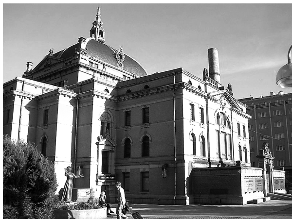
Ryc. 25. Teatr Narodowy. Oslo. H. Bulla, 1899 Fig.25. National Theatre. Oslo. H. Bulla, 1899