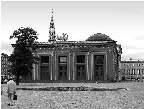
Ryc. 6. Muzeum Thorvaldsena. Kopenhaga. M.G. Bindesbøll, 1840-1844 Fig. 6. Thorvaldsen Museum. Copenhagen. M.G. Bindesbøll, 1840-1844