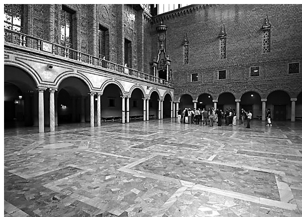
Ryc. 31. Ratusz, dziedziniec. Sztokholm. R. Östberg, 1908-1923 Fig.31. Town Hall, courtyard. Stockholm. R. Östberg, 1908-1923