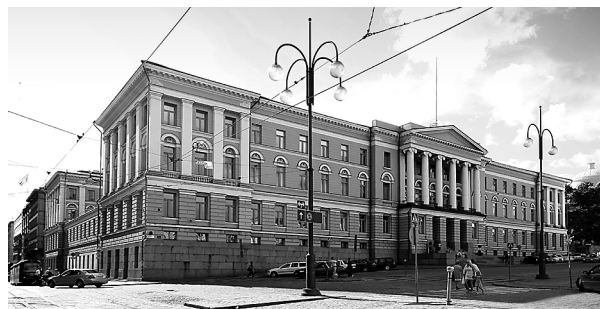
Ryc. 9. Uniwersytet. Helsinki. C.L. Engel, 1828-1832 Fig. 9. The University. Helsinki. C.L. Engel, 1828-1832