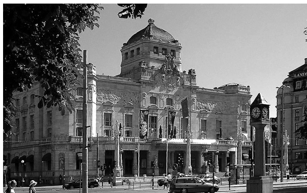
Ryc. 26. Królewski Teatr Dramatyczny. Sztokholm. F. Lilljekvist, 1908 Fig.26. Royal Drama Theatre. Stockholm. F. Lilljekvist, 1908