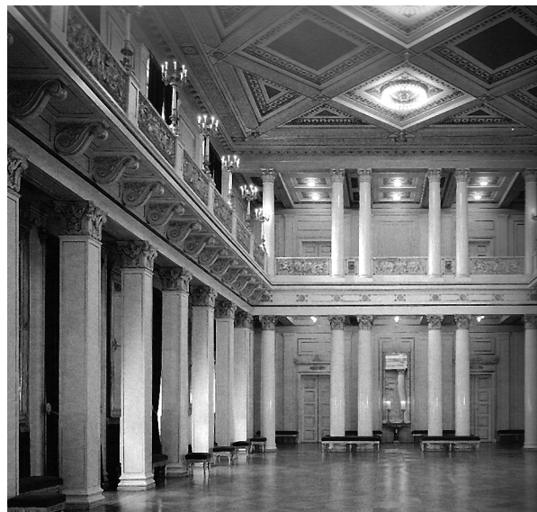
Ryc. 3. Pałac Królewski. Sala balowa. Oslo. H.D.F. Linstow, 1823-1848 Fig. 3. Royal Palace. Ballroom. Oslo. H.D.F. Linstow, 1823-1848