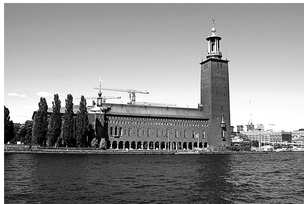
Ryc. 30. Ratusz. Sztokholm. R. Östberg, 1908-1923 Fig.30. Town Hall. Stockholm. R. Östberg, 1908-1923