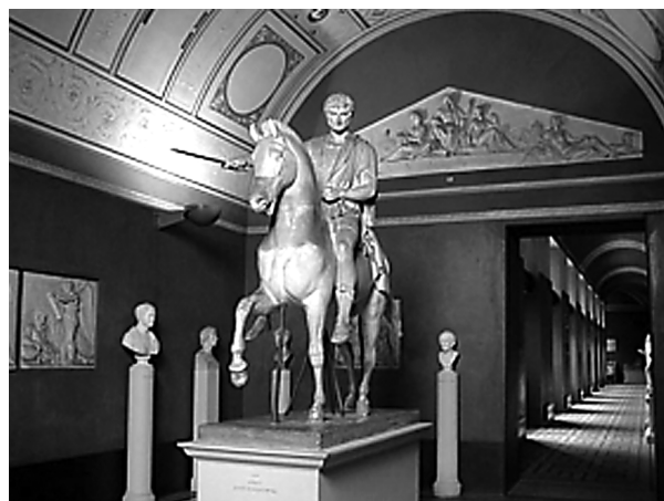
Ryc. 11. Muzeum Thorvaldsena, hall główny. Kopenhaga. M.G. Bindesbøll, 1840-1844 Fig. 11. Thorvaldsen Museum, main hall. Copenhagen. M.G. Bindesbøll, 1840-1844