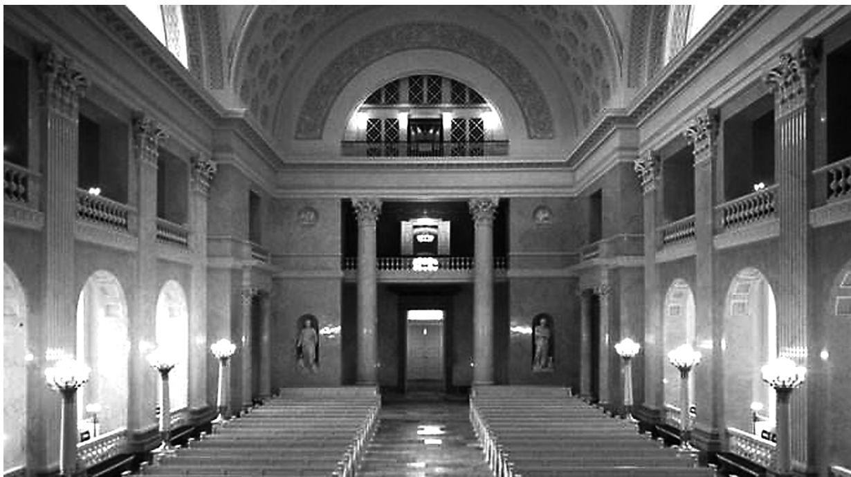
Ryc. 1. Pałac Christianborg, kaplica, wnętrze. Kopenhaga. Ch.F. Hansen, 1803-1840 Fig. 1. Christianborg Palace, chapel, interior. Copenhagen. Ch. F. Hansen, 1803-1840

An indisputable and permanent place of eminence in Copenhagen was held by architect Christian Fredrik Hansen, a senior of a family of architects. He received all important public commissions, realised during the first two decades of the 19 th century. As a professor at the Copenhagen Royal Academy of Art, in the years 1808-1835, he left his mark on a whole generation of architects – not only in Denmark but also in Norway. The Hansen family significantly influenced architecture in e.g. Munich, Athens and Vienna. In Scandinavia, and particularly