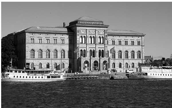
Ryc. 19. Muzeum Narodowe. Sztokholm. F.A. Stüler, 1844-1866 Fig.19. National Museum. Stockholm. F.A. Stüler, 1844-1866