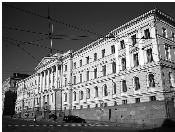
Ryc. 8. Senat. Helsinki. C.L. Engel, 1818-1822 Fig. 8. The Senate. Helsinki. C.L. Engel, 1818-1822