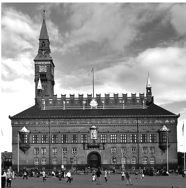
Ryc. 28. Ratusz. Kopenhaga. M. Nyrop, 1892-1902 Fig.28. Town Hall. Copenhagen. M. Nyrop, 1892-1902