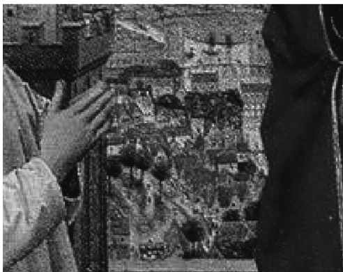
II. 5. Petrus Christus, Madonna Exeter, 1450 (fragment); Berlin, Die Staatlichen Museen