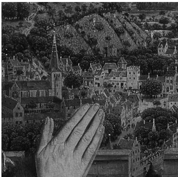
II. 4. Jan van Eyck, Madonna z kanclerzem Rolin , 1435 (fragment); Paryż, Luwr