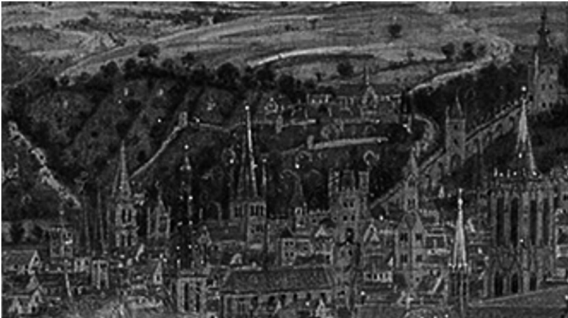
Il. 3. Jan van Eyck, Madonna z kanclerzem Rolin , 1435 (fragment); Paryż, Luwr