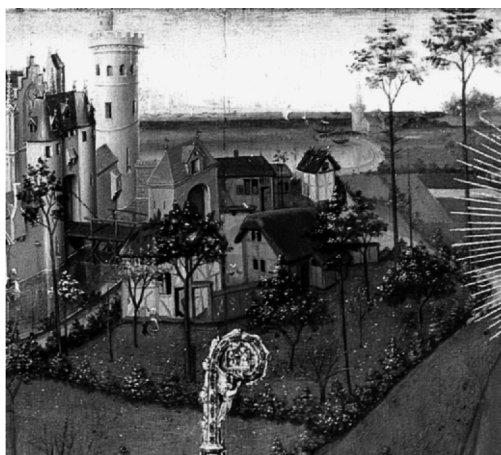
Il. 2. Jacques Daret, Nawiedzenie św. Elżbiety , 1434-1435 (fragment); Berlin, Die Staatlichen Museen

Inny niż opisany wyżej kompleks podmiejski przedstawia tablica Jacquesa Daret'a Nawiedzenie św. Elżbiety 27 . Po lewej stronie tego obrazu, w tle religijnego zdarzenia, widoczne jest miasto połączone z przedmieściem, w którym dostrzec można czytelnie wyznaczoną przestrzeń ogrodową (il. 2). Jest to prawdopodobnie sad, o czym świadczą namalowane drzewa. Ich wygląd sugeruje, że są to różnego gatunku drzewa owocowe w fazie kwitnienia lub owocowania. Wskazuje na to fakt, że część z nich ma wyraźnie biało i różowo nakrapiane korony, inne zaś posiadają czerwone cętki na ciemnozielonym tle liści. Również ich pokrój i rozmiary potwierdzają powyższe przypuszczenia. Drzewa te nie rosną w ściśle określonym układzie kompozycyjnym. Zajmują swobodnie przestrzeń ogrodu, którego geometryczne zarysy wyznaczają linie zabudowy oraz żywopłoty. Te ostatnie utworzone są prawdopodobnie ze swobodnie rozrośniętych krzewów liściastych. Wyraźnie wydziela on cały ogród z otaczającego krajobrazu. Jednocześnie ich niewielka wysokość zapewnia powiązanie widokowe z okolicznymi terenami. Uzupełnieniem tej swoistej granicy są drzewa, które znajdują się w linii żywopłotów i swoją wysokością znacznie odbiegają od pozostałych. Namalowany sad nie posiada wyznaczonych ścieżek, małej architektury i elementów wodnych. Jego wystrój uzupełnia jedynie murawa pokryta kwiatami oznaczonymi za pomocą licznych kolorowych plamek farby.