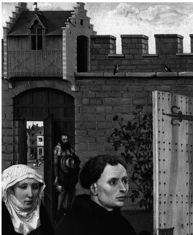
II. 6. Robert Campin, Ottarz Mérode, tablica lewa, 1425-1430 (fragment); Nowy Jork, Metropolitan Museum