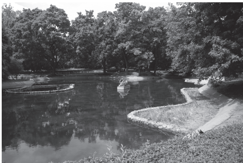
II. 3. Widok na wnętrze ze stawem (foto J. Łukaszewicz, 2011)

Do restauracji parku przystąpiono w latach 50. XX w. Ostatecznie odwołano się do dawnych planów Szaniora, dokonując niewielkich zmian, np. w formie gazonu przed pałacem (zrezygnowano z tarasowości gazonu oraz kwietnika otaczającego fontannę, utworzono natomiast przejście od pałacu na osi głównej, dzieląc tym samym gazon na dwie równe części z wolno stojącą fontanną pośrodku). Powiększono powierzchnię parku do 7,2 ha, włączając nowe tereny – w części północnej, po nowej regulacji ul. Świętojerskiej, oraz w części południowej – tereny dawnych ogrodów (m.in. pałacu Marii Radziwiłłowej, pałacu „Pod Czterema Wiatrami”) oraz obszary przedwojennej zniszczonej zabudowy (m.in. słynnego handlowego Pasażu Simonsa). Od strony ul. Nowotki (obecnie ul. Andersa) utworzono zieleniec, pełniący funkcję osłonową dla parku (powierzchnia 2,8 ha), likwidując tym samym jedną z najważniejszych przedwojennych ulic Warszawy – ul. Nalewki (sygnalnie pozostawiono jedynie niewielki jej fragment).