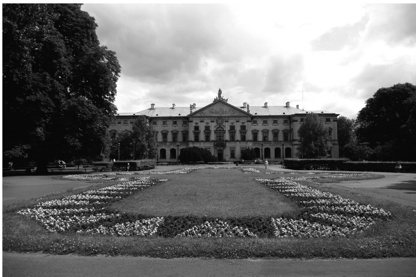
II. 1. Widok na elewację ogrodową Pałacu Krasińskich przez centralny parter kobiercowy (foto J. Łukaszkiewicz, 2011)

W czasach Królestwa Kongresowego pałac był siedzibą Sądu Najwyższej Instancji. Na początku XIX w. przystąpiono do „podnoszenia i upiększania stolicy” (w początkowym okresie rządów car Aleksander I pozostawał przychylny Polakom 2 ), w tym także do porządkowania otoczenia pałacu i jego restaurowania – w tym czasie na pl. Krasińskich ustawiono, zachowane do dzisiaj, żeliwne obudowy studni zaprojektowane przez Christiana Piotra Aignera (1823 r.) 3 .