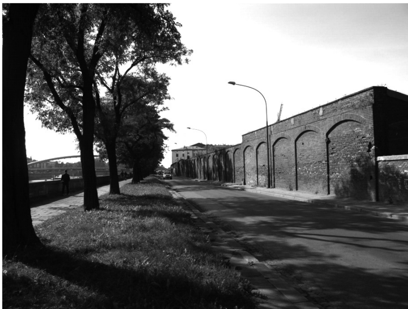
II. 3. Fragment ul. Podgórskiej na krakowskim Kazimierzu; przykład odcinka Bulwarów Wiślanych wymagających interwencji przewidzianych Planem Działań dla Kazimierza

Ważnym momentem formułowania strategii rewitalizacji, jest kojarzenie celów działań z podsta-