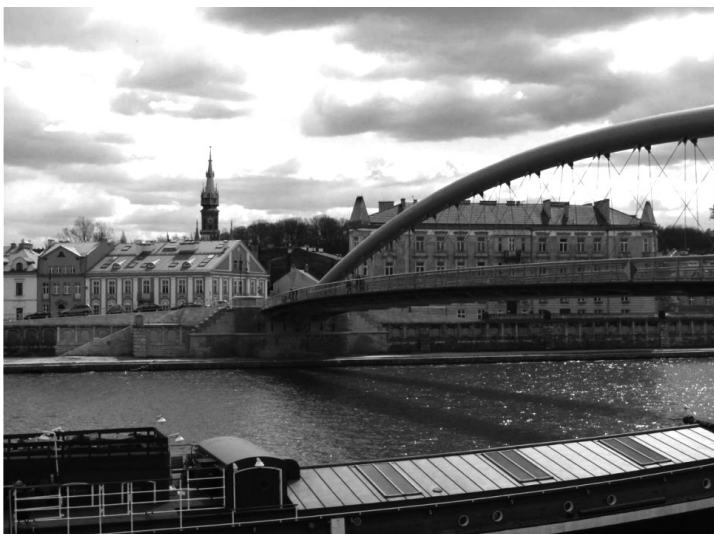
II. 4. Kładka piesza między Kazimierzem i Podgórzem przyczyniła się do ożywienia tej części nadwiślańskiego bulwaru