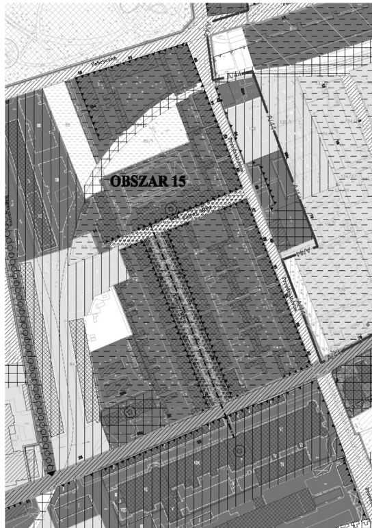
PRZYKŁADOWE WYTYCZNE PRZESTRZENNE