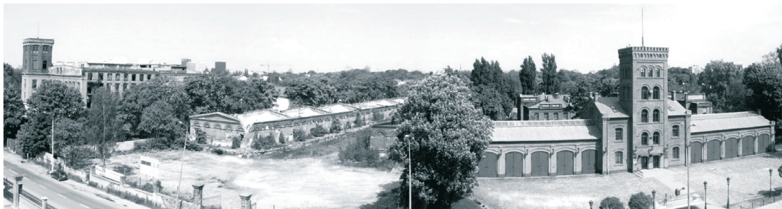
II. 2. „Księży Młyn”, Fragment przestrzeni w założeniu K. Scheiblera