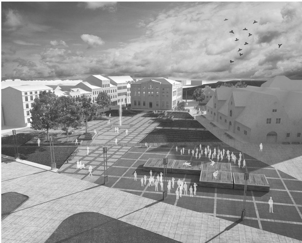
II. 3. Widok na Plac Wałowy od strony północnej z jednym z możliwych ustawień platform. Swoboda aranżacji placu zapewnia jego multifunkcyjność, a charakterystyczna i wyrastająca z lokalnej tradycji forma podkreśla jego unikalność