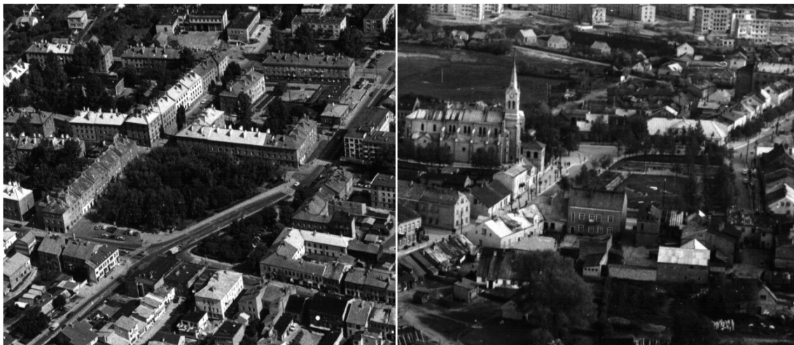
II. 2. Rynki w Zambrówie (po lewej) i Grajewie (po prawej)