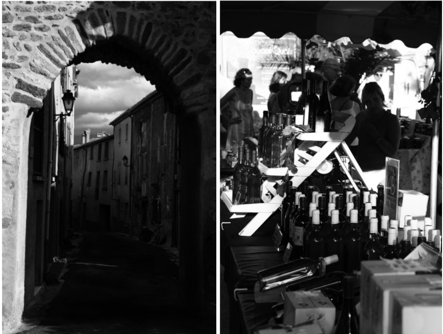
II. 1. Miasta których vitalność została przywrócona przez odtworzenie bądź rozwój funkcji tradycyjnej: a) jedna z malowniczych ulic Mosset, b) targ wina i lokalnych produktów w Beaucaire