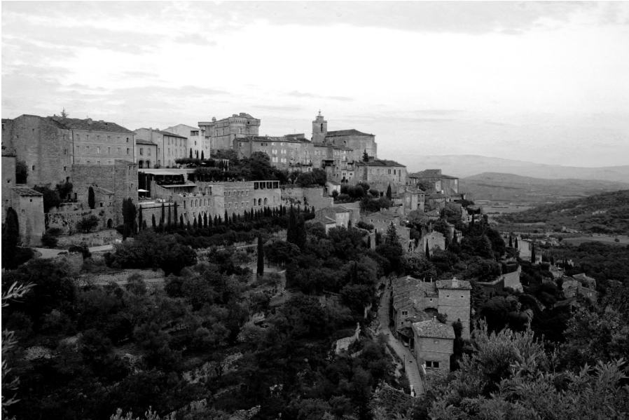
II. 4. Gordes – miasteczko o kameralnym charakterze, o funkcjach rekreacyjnych i wypoczynkowych o szczególnie wysokim standardzie (fot. A. Wójtowicz, 2011)