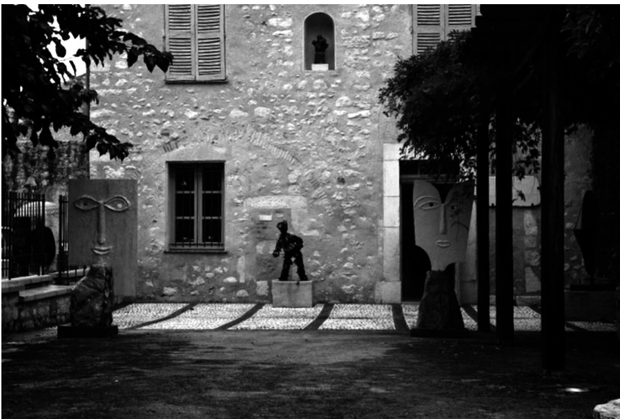
II. 5. St. Paul de Vence – miasteczko łączące w sobie zabytkowe wartości i współczesną sztukę