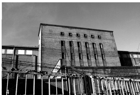
II. 7–8. Muzeum Sztuki Współczesnej MOC AK w Krakowie