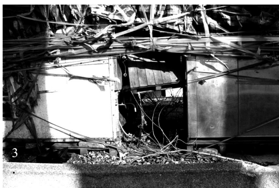
III. 5–6. Residential complex „Garden Residence” in Cracow