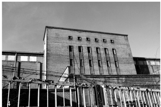
II. 1–4. Stare Zabłocie