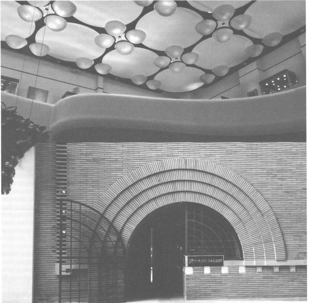
Frank Lloyd Wright: Xanadu Gallery. San Francisco