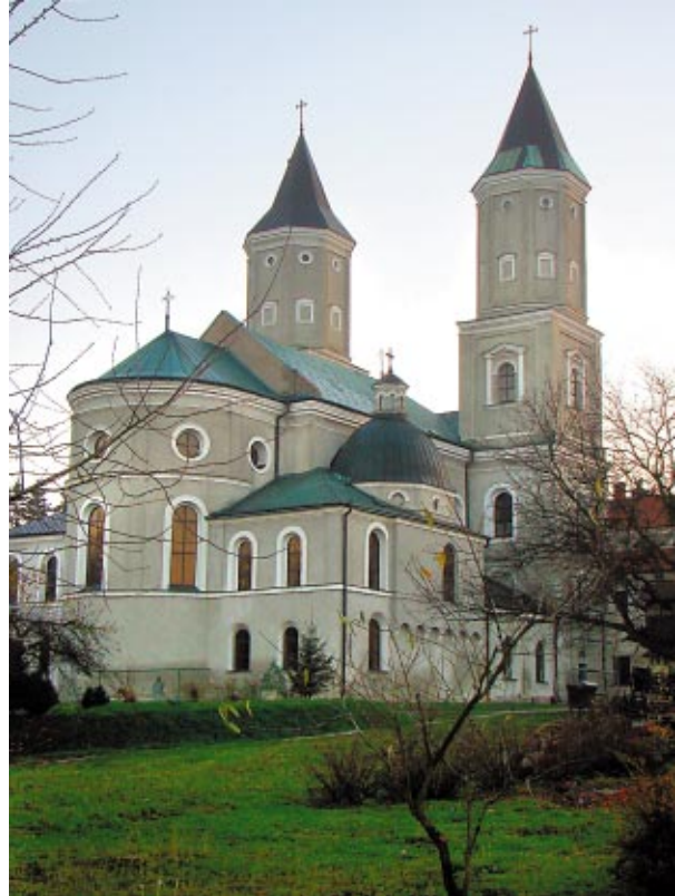
Ryc. 5. Widok od strony półn. na świątynię Fig. 5. View onto the church from the north

Fig. 1 The hill of St. Nicholas against the panorama of Jarosław acc. to Information Bulletin of the Town of Jarosław, NO 12 ( 194 ) YEAR XVI, December 2008, p. 15