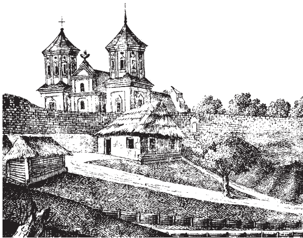
Ryc. 2. Widok od strony pld. na klasztor i kościół benedyktynek drzeworyt z I poł. XVII wieku wg rys. z „Przyjaciela Ludu” z 1846 r. Repr. H. Górecki

Fig. 2 View from the south onto the Benedictine convent and church, woodcut from the first half of the 17 th century, acc. to a drawing in “Przyjaciel Ludu” – 1846. Repr. H. Górecki