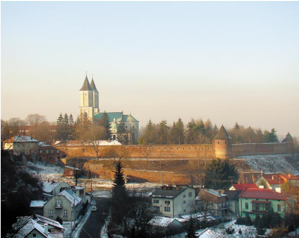
Fig. 4. View from the south onto the current buildings on the hill of St. Nicholas