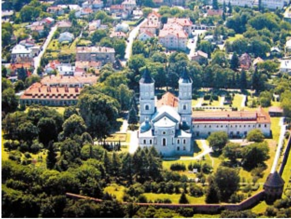
Ryc. 1. Wzgórze św. Mikołaja na tle panoramy Jarosławia wg Biuletynu Informacyjnego Miasta Jarosławia, Nr 12 (194) Rok XVI, grudzień 2008, s. 15

Fig. 1 The hill of St. Nicholas against the panorama of Jarosław acc. to Information Bulletin of the Town of Jarosław, NO 12 ( 194 ) YEAR XVI, December 2008, p. 15