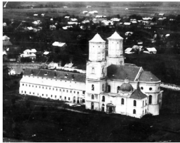
Ryc. 3. Widok klasztoru i kościoła „z lotu ptaka” w 1927 roku (Archiwum Muzeum w Jarosławiu, MJ F 3098)

Fig. 2 View from the south onto the Benedictine convent and church, woodcut from the first half of the 17 th century, acc. to a drawing in “Przyjaciel Ludu” – 1846. Repr. H. Górecki