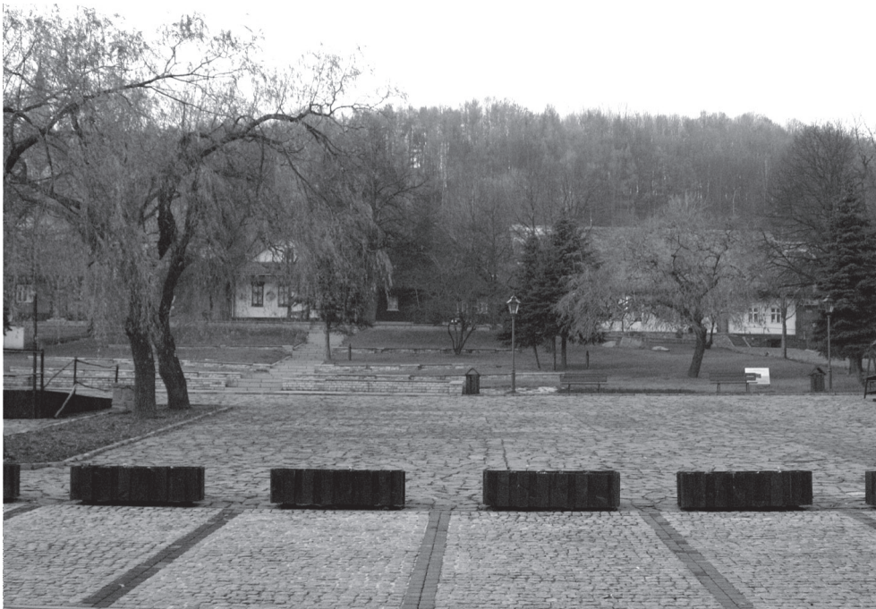
II. 4. Projekt pt. Odnowa nawierzchni w Rynku w Lanckoronie – uporządkowanie zieleni dofinansowywany został ze środków zewnętrznych (fot. A. Wójtowicz-Wróbel, 2006)