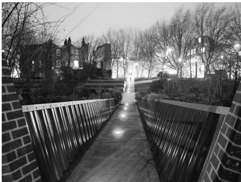
Rys. 5. Widok Blue Wall Alley – reinterpretacja XVI-wiecznej alei, fot. Planet Earth Landscape Architects, Forest Row w Anglii

aby otworzyć park na przyległe ulice i place. Ten zabieg pozwolił na ukształtowanie interesujących wnętrz krajobrazowych o niezwyklej geometrii i mnogości powiązań, a jednocześnie zwiększył poczucie bezpieczeństwa ich użytkowników. Park został rozwiązany jako jedna otwarta przestrzeń, bez ścieżek spacerowych, co pozwoliło powiązać jego elementy funkcjonalne w swobodny sposób. Surowy charakter nadają mu przecinające jednolity trawnik proste ciągi komunikacyjne oraz tarasy wycięte w gruncie stalowymi fałdowymi blachami, z prostymi siedziskami z drewna dębowego (rys. 6). Na obwodzie parku zasadzono miejscowe drzewa i krzewy, tworząc z nich dodatkową naturalną barierę i jednocześnie przestronę graffiti na murze granicznym. Utworzono też nowe mokradła i zarośla, przez co zwiększono różnicowanie biologiczne tego obszaru.