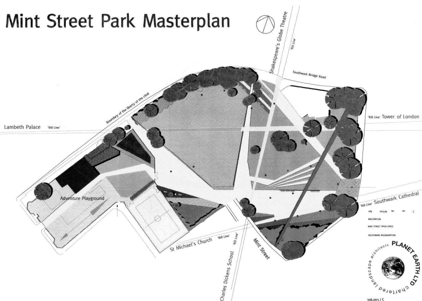
Rys. 4. Plan Mint Street Park, rys. Planet Earth Landscape Architects, Forest Row w Anglii Fig. 4. The plan of the Mint Street Park, elab. Planet Earth Landscape Architects, Forest Row in England

U podstaw rozwiązania krajobrazowego legła analiza dawnych map, która pozwoliła odczytać zatarte rozplanowanie tego miejsca, jak i jego zapomniane przez dzisiejszych mieszkańców znaczenie, wciąż zapisane w nazwach nieistniejących już ulic (rys. 4). Rekompozycja parku miała przywrócić temu miejscu jego fizyczny, jak i historyczny kontekst. Uzyskano to przez odtworzenie powiązań widokowych sięgających daleko poza granice parku, a także przywołanie w planie parku dawnych ulic: Blue Wall Alley – łączącej Southwark Bridge Road i Mint Street, oraz Bandy Leg Walk – przebiegającej w poprzek południowo-zachodniej części posesji (rys. 5). W ten sposób uzyskano efekt wtopienia nijakiego dotychczas miejsca w gęstą zurbanizowaną strukturę tej części miasta. Pozwoliło to nie tylko na zmianę krajobrazu dzielnicy, ale też na odbudowanie utraconego dotychczas poczucia posiadania tego miejsca przez jego mieszkańców.