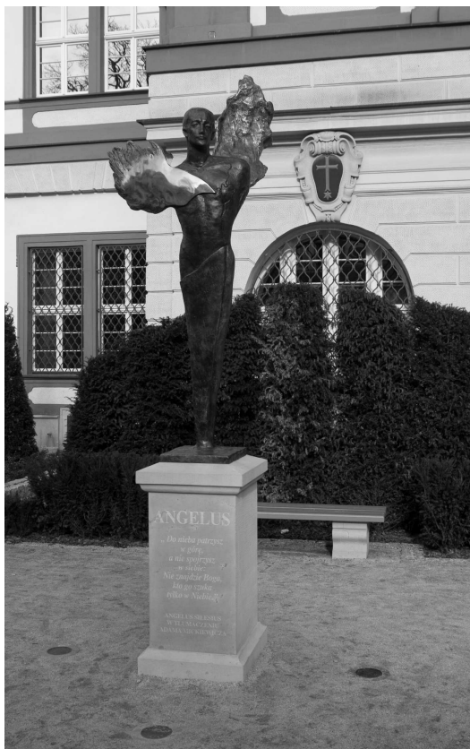
Rys. 3. Widok wnętrza ogrodu z pomnikiem Angelusa Silesiusa, fot. M. Stepowicz

W przypadku Ogrodu Ossolineum „odkryta mapa” architektoniczna umożliwiła odczytanie pierwotnej funkcji miejsca, która stała się wiodącym motywem nowego rozwiązania. W planie ogrodu odnotowano jego pierwotny układ, a także kolejne przemiany przestrzenne, realizując przy tym program użytkowy odpowiadający współczesnej społeczności Wrocławia. Charakterystyczne dla tego rozwiązania jest to, że wnętrza ogrodu kształtowane jest wyłącznie o dawne wzory