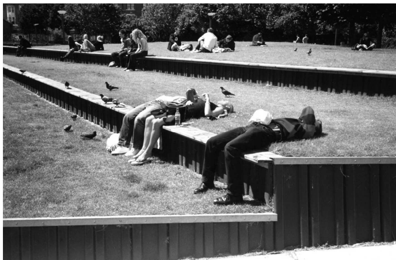
Rys. 6. Zielone tarasy służą jako miejsce interakcji społecznej, fot. Planet Earth Landscape Architects, Forest Row w Anglii