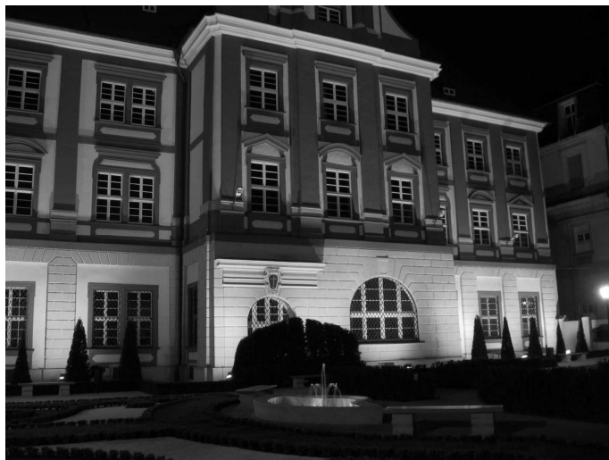
Rys. 2. Widok wnętrza ogrodu przy południowej elewacji Ossolineum, fot. Autorska Pracownia Architektury „Linea” we Wrocławiu