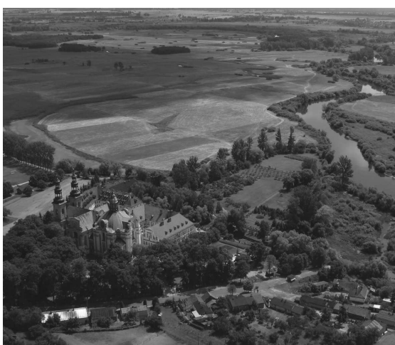
Rys. 1. Dawne opactwo cysterskie w Łądzie nad Wartą, widok od strony północno-zachodniej

ogrodów klasztornych oraz uporządkowanie placu przed kościołem kapucyni przeprowadzili sukcesywnie własnymi siłami. Efekt ich starań wraz z dyspozycją klasztornych ogrodów dokumentuje klasztorna Kronika oraz najstarszy zachowany plan zabudowań i zagospodarowania terenu wokół dawnego łądzkiego opactwa – jest to Plan sytuacyjny klasztoru kościoła zabudowań i ogrodów klasztornych we wsi Lendzie. Powiat koniński. Gubernia warszawska . Dokument ten, sygnowany przez A. Nowaka i B.P. Kamińskiego, został sporządzony ok. 1865 roku po likwidacji kapucyńskiego klasztoru przez rząd carski w czerwcu 1864 roku i prezentuje rzut budowli dawnego założenia cysterskiego z naniesionymi terenami wokół niego, w tym również ogrodami klasztorными 13 (rys. 2).