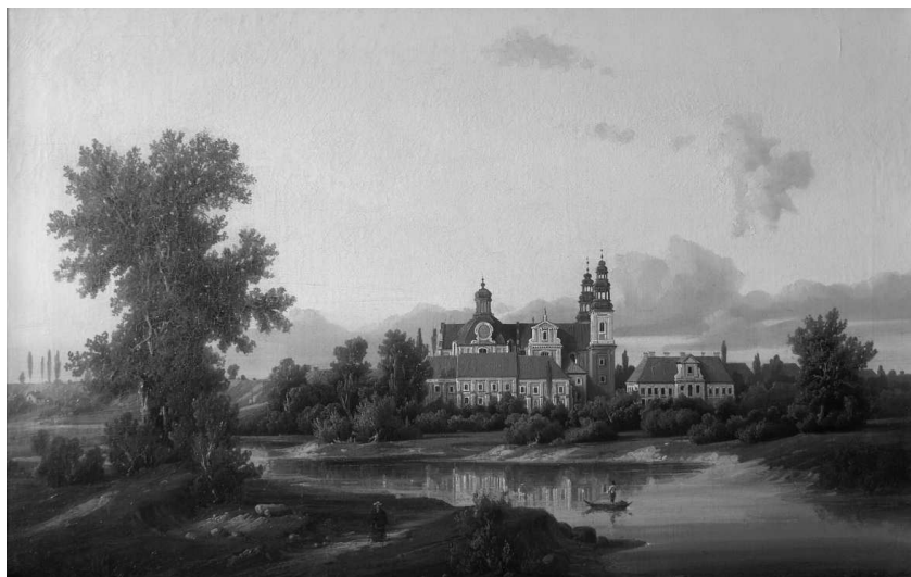
Rys. 3. Marcin Zaleski, Opactwo w Łądzie, widok od strony Warty , ok. 1860 r., olej na płótnie. Najstarszy zachowany widok łądzkiego opactwa z niezachowanym dziś pałacem opata Łukomskiego Fig. 3. Marcin Zaleski, The abbey in Łódź, view to Warta , circa 1860, oil on canvas. The oldest preserved view of the Łódź abbey with a non-existent palac of abbot Łukomski