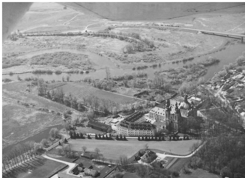
Rys. 4. Dawne opactwo cysterskie w Łądzie nad Wartą, widok od strony północno-wschodniej, u dołu teren dawnego ogrodu opackiego, w głębi ogród na wyspie, po prawej park przykościelny Fig. 4. The former Cistercian abbey in Łódź upon Warta, view to the northeast, former abbot garden (down), a garden on the island and a church park