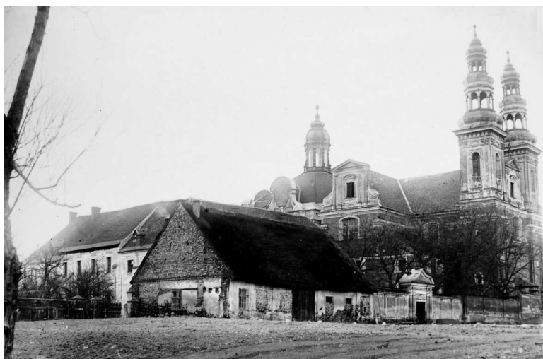
Rys. 6. Widok opactwa w Łądz od strony południowo-wschodniej, teren po rozebranych pałacu opata łukomskiego i południowej części opackiego ogrodu z widoczną pozostałością parteru oficyny pałacu, zdjęcie z ok. 1910 r.

fotografia z ok. 1910 roku (rys. 6). Na tym miejscu, w latach 30. XX w., stanęły budynki gospodarcze, rozbudowane w latach 1957–1968 31 . Pod koniec XX w. i w 2007 roku większość budynków gospodarczych została rozebrana.